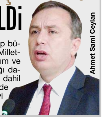
Ahmet Sami Ceylan

Çorum'da hayvancılık ve besicilik sektörünün gelişip büyümesi için önemli bir adım atıldı. AK Parti Çorum Milletvekili Ahmet Sami Ceylan'ın girişimleri ile Gıda Tarım ve Hayvancılık Bakanlığı'nın sadece 31 ilde uyguladığı damızlık koç-teke yetiştiriciliği projesine Çorum da dahil edildi. Ayrıca bakanlığın hem damızlık düve hem de damızlık koç yetiştiriciliği olmak üzere her iki projeyi uyguladığı 10 il arasına girmeyi başardık. 4'DE