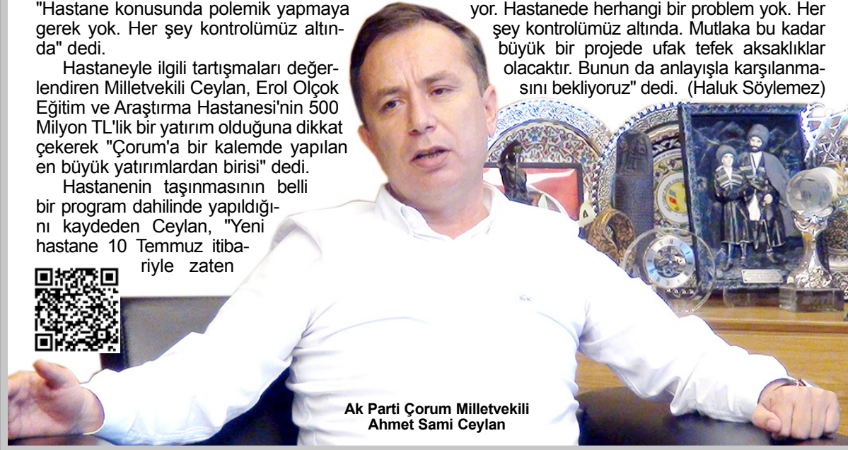
Ak Parti Çorum Milletvekili Ahmet Sami Ceylan

muayene hizmeti vermeye başladı. Ancak eski hastanede yatanların sağlık hizmetinin de kesilmemesi için taşınma işlemi plan içerisinde yapıyor. Hastanede herhangi bir problem yok. Her şey kontrolümüz altında. Mutlaka bu kadar büyük bir projede ufak tefek aksaklıklar olacaktır. Bunun da anlayışla karşılanmasını bekliyoruz" dedi. (Haluk Söylemez)