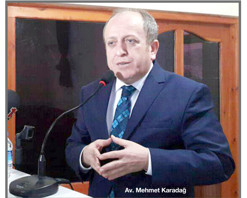
Av. Mehmet Karadağ

Cumhurbaşkanı Recep Tayyip Erdoğan'ın "tek adamlık için bu sistemin değiştirilmesini istiyor" denildiğini ifade eden Karadağ, "Tayyip Erdoğan'ın buna ihtiyacı