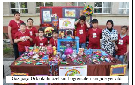
Gazipaşa Ortaokulu özel sınıf öğrencileri sergide yer aldı