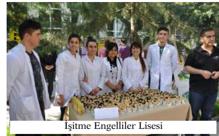
İşitme Engelliler Lisesi