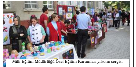
Milli Eğitim Müdürlüğü Özel Eğitim Kurumları yılsonu sergisi