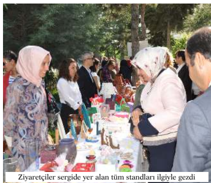
Ziyaretçiler sergide yer alan tüm standları ilgiyle geziyor