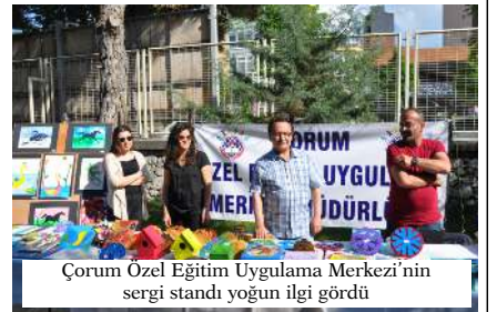
Çorum Özel Eğitim Uygulama Merkezi'nin sergi standı yoğun ilgi gördü