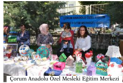
Çorum Anadolu Özel Mesleki Eğitim Merkezi