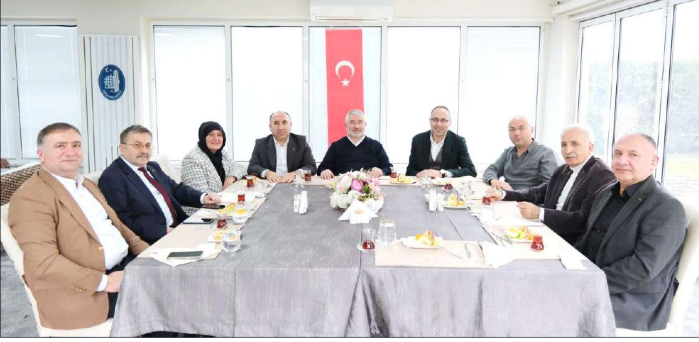
Başkan Aşgın, aday adaylarıyla bir araya geldi.