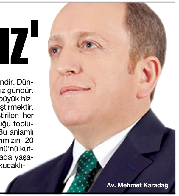
Av. Mehmet Karadağ

ramı tarihte ilk ve tek örneklerdendir. Dünya çocuklarıyla ele ele kutladığımız gündür. Çocuklarımıza yapacağımız en büyük hizmet onları sevgi ve şefkatle yetiştirmektir. Çünkü, sevgi ve şefkatle yetiştirilen her çocuk büyüdüğünde bireyi olduğu topluma sevgi ve şefkat verecektir. Bu anlamlı gün vesilesiyle? tüm çocuklarımızın 20 Kasım Dünya Çocuk Hakları Günü'nü kutluyor, çok daha güzel bir dünyada yaşamaları dileği ile onları sevgiyle kucaklıyorum." (Haber Merkezi)