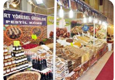
50 farklı ilden 81 firmanın katıldığı Fuar 31 Ocak tarihine kadar açık kalacak.