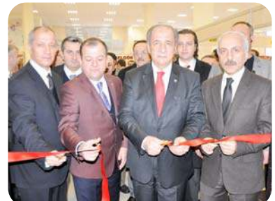
1. Ülkeler El Sanatları ve Hediyeleş Eşya Alışveriş festivali açıldı

Açılış ardından çeşitli illerden Çorum'a gelerek ürünlerini tanıtan firmalar ziyaret edilerek, yiyecek stantlarında tadımlar yapıldı. Açılış öncesinde konuşan Vali Ahmet Kara, Çorum'un yöresel yiyeceklerinin çok fazla olduğunu kaybolmaya yüz tutmuş birçok ürünün ve yiyeceğin tanıtımının yapılması gerektiğini belirterek, tanıtımlar açısından fuarların çok önemli olduğunu vurguladı. Anadolu olarak yöresel yiyeceklerin ve hediyeleş eşyalarının oldukça zengin olduğunu dikkat çeken Vali Kara, "Osmanlı'dan gelen mutfaklarımız var. 600 çeşit yememiz var. Bunların tanıtımını yapmamız gerekiyor. Çorum'da bu tür festivallerin yapılmasına ve fuarların açılmasına öncülük eden TSÖ'yu tebrik ediyoruz. Bundan sonra da periyotlar halinde bu fuarların yapılması tanıtım açısından büyük önem taşıyacaktır. Dünya tanıtımla idare edilmiyor. Dünya artık algi reklam dünyasıdır. Çorum'da has baklavamız, Çorum 5'limiz, Kargı bamyamız, Sırık kebapımız, İskilip dolmamız var. Hititlerin yemek kültürü de var. Elimizde var olan değerlerimize önem vermeliyiz" diye konuştu. (Haluk SÖYLEMEZ)