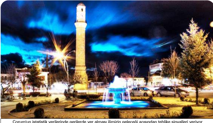
Çorum'un istatistik verilerinde gerilerde yer alması ilimizin geleceği açısından tehlike sinyalleri veriyor

TÜİK verilerine göre bireylerin topluma ve ekonomiye verimli bir şekilde katılması için gerekli bilgi, beceri ve yeterliliklerin sağlanmasında büyük öneme sahip eğitim boyutu endeksinde ilk sırayı Tunceli aldı. Isparta ikinci, Amasya üçüncü sırada yer aldı. Son sırada ise Hakkari, Şırnak ve Ağrı yer aldı.