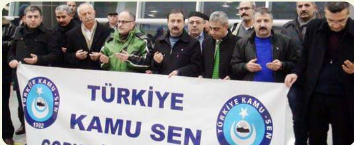
Türkiye Kamu-Sen üyelerine yönelik yarılı tatilinde umre organizasyonu düzenlendi.