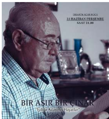
BİR ASIR BİR ÇINAR "Yılışlı Adamın Hayatları"