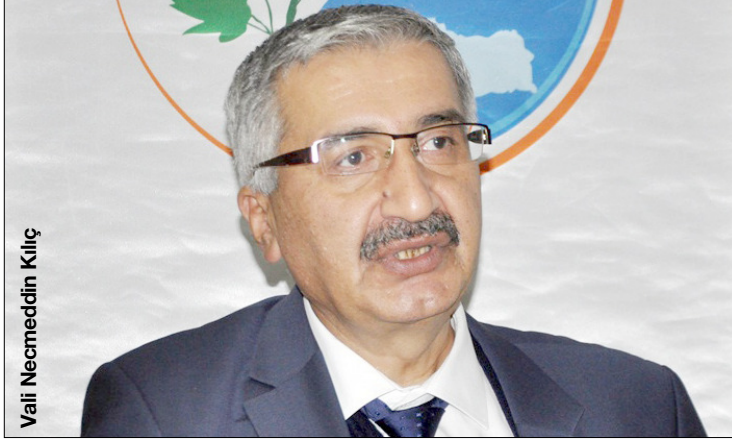
Vali Necmeddin Kılıç

"Çorum Valliliği bünyesinde şuanda 20 bin personel çalışıyor. Her birinden istifade edebilirsek, Çorum'u çok daha ötelere taşıyabiliriz. Önemli olan zamanı, insanı iyi kullanabilmektir. Bunu yapabilmek için bir misyonumuzun, vizyonumuzun ve planımızın olması