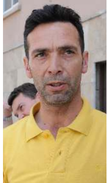
sorunlarını anlattı. (Ebru ÇALIK)

Bıyık, esnaf olarak kendi araçlarını başka mahallelere park ettiklerini ancak müşteri durmadığı zaman bu sokakta esnafı yapmanın bir anlamının olduğunu ifade ederek, "Park yeri kapandığı için müşterinin durma şansı yok. 5 saniye bile dursa ceza yiyor. Bizim işlerimizi bu şekilde aksatıyor. Biz başka mahallelere kadar park ediyoruz aracımızı. Müşteri durmadığı zaman bizim burada esnafı yapmamızın bir anlamı kalmıyor. Bu yönden çok mağduru. Bir çözüm bulunmasını istiyoruz" diye