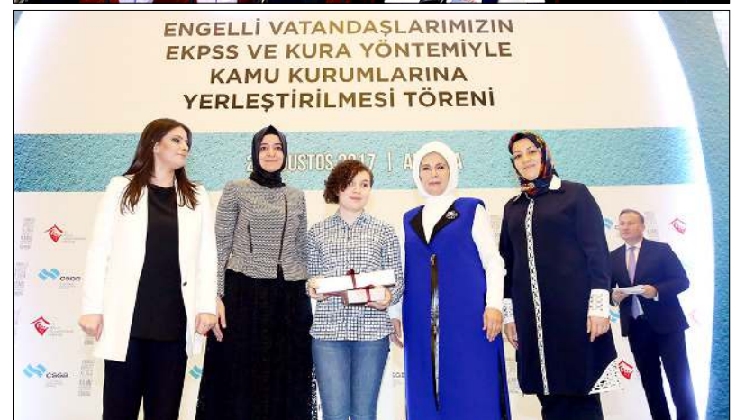
ENGELLİ VATANDAŞLARIMIZIN EKPSS VE KURA YÖNTEMİYLE KAMU KURUMLARINA YERLEŞTİRİLMESİ TÖRENİ