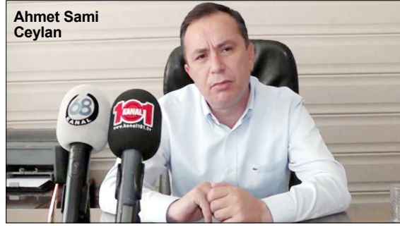
Ahmet Sami Ceylan