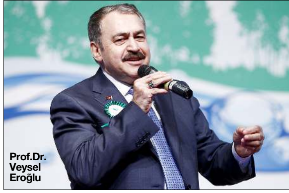
Prof. Dr. Veysel Eroğlu

Bakanlık olarak vatandaşlara menba kalitesinde içme suyu temin etmek için projeleri bir bir hayata geçirdiklerinin altını çizen Orman ve Su İşleri Bakanı Prof. Dr. Veysel Eroğlu "Bayat'ta da böyle bir projenin sonuna yaklaştık. Bölgenin içme suyu problemini kökünden çözüyoruz. Çorum için su alanında yapacağımız yatırımlar sürecektir. Çorum en büyük yatırımları bizim dönemimizde aldı. Bundan sonra da böyle olacak" değerlendirmesinde bulundu. (Haber Merkezi)