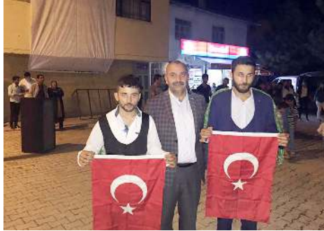
Ortaköy'de vatani görevini yapacak üzere askere gidecek olan gençler Ortaköy İlçe Meydanı'nda düzenlenen eğlenceye, ilçe halkı da yoğun ilgi gösterdi.