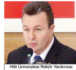
Hitit Üniversitesi Rektör Yardımcısı Prof. Dr. Mustafa Bıyık

riminde sözleşme imzalanarak yapımına başlandı da sözleşmeden itibaren 600 gün içerisinde yapımı tamamlanacağı düşünülmekteydi. Kapalı spor tesislerine bakıldığında yine 600 günlük süre içerisinde tamamlanması hedeflenen bu binamızın kapalı alanı 8 bin 600 metre kare olacaktır. Merkez yemekhanemiz tamamlanmış 8 bin 490 metre karelik kapalı alana sahip olacaktır. İlahiyat Fakültesi 2 blokta oluşmakta bin 299 gün içerisinde tamamlanması hedeflenmekte olup tamamlanmış 18 bin 150 metre kare olacaktır. İktisadi ve İdari Bilimler Fakültesi'nin bakıldığında İlahiyat Fakültesi ile tamamlanacak tamamlan-