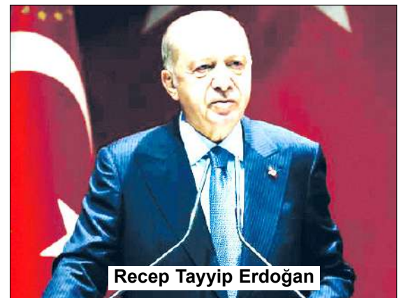
Recep Tayyip Erdoğan

"Eğitim dedik, okullarımızın neredeyse tamamını yeniden inşa ettik. Evlatlarımızın en iyi şekilde yetişmesi için 800 bin yeni öğretmen atadık. Darbecilerin yıktığı mesleki eğitim sistemini yeniden ayağa kaldırdık. Şehir hastaneleriyle sağlık hizmetlerini dünya standartlarının üzerinde seviyeye taşıdık. 310 bini doktor olmak üzere 1.5 milyona yakın sağlık çalışanıyla