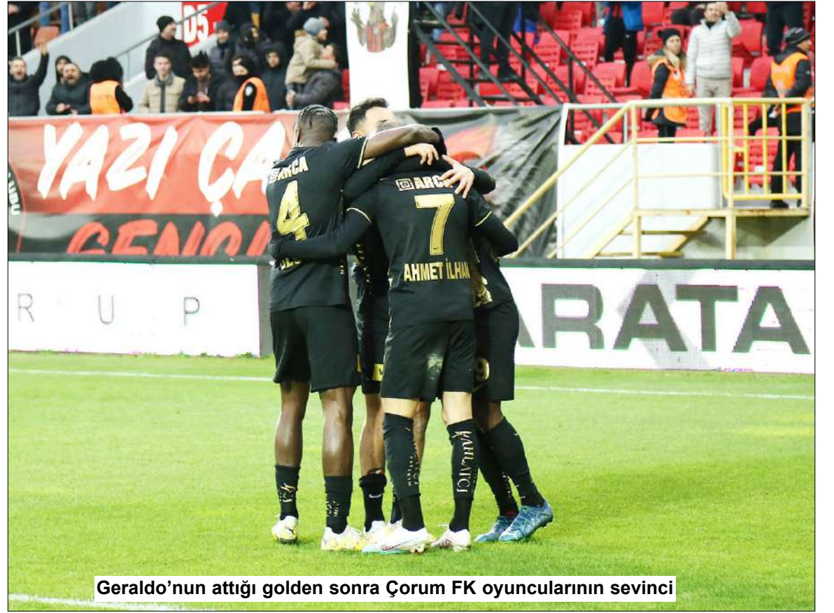
Geraldo'nun attığı golden sonra Çorum FK oyuncularının sevinci

Hata sonucu kalesinde golü gören Ahlatçı Çorum FK gerekli reaksiyonu gösterdi. Kırmızı-Siyahlılar yediği golden yedi dakika son-