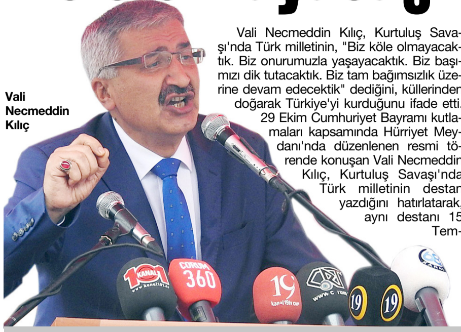
Vali Necmeddin Kılıç

Vali Necmeddin Kılıç, Kurtuluş Savaşı'nda Türk milletinin, "Biz köle olmayacaktık. Biz onurumuzla yaşayacaktık. Biz başımızı dik tutacaktık. Biz tam bağımsızlık üzerine devam edecektik" dediğini, küllerinden doğarak Türkiye'yi kurduğunu ifade etti. 29 Ekim Cumhuriyet Bayramı kutlamaları kapsamında Hürriyet Meydanı'nda düzenlenen resmi törende konuşan Vali Necmeddin Kılıç, Kurtuluş Savaşı'nda Türk milletinin destan yazdığını hatırlatarak, aynı destanı 15 Temmuz'da da yazdığını söyledi. "Bu gençler, bayrağımızı en yukarı dikecektir" diyen Vali Kılıç, konuşmasında şu ifadelere yer verdi: