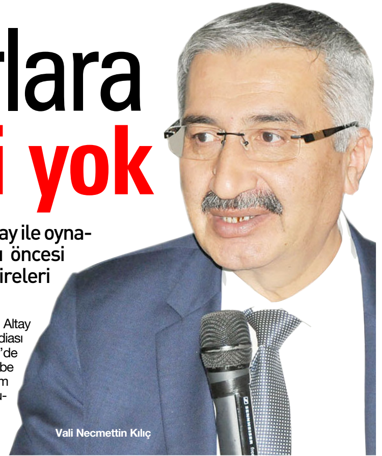
Vali Necmettin Kılıç

Vali Necmettin Kılıç'tan bugün oynanacak olan Altay maçı öncesinde memurlara maç izni verildiği iddiası doğru çıkmadı. Çorum Valiliği'nden saat 21.00'de yapılan sms bilgilendirmesinde "04.05.2017 perşembe günü tüm gün boyunca her zamanki gibi okullar eğitim ve öğretime devam edecek, kamu kurum ve kuruluşlar da hizmet verecektir" denildi. (Haber Merkezi)