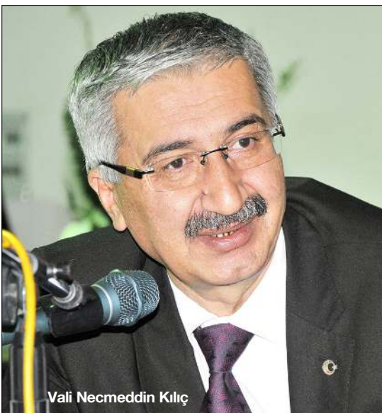
Vali Necmeddin Kılıç

Vali Necmeddin Kılıç, İl Özel İdare tarafından hayvan üreticilerine destek vermek amacıyla küçükbaş hayvanlar için alınan küpe parasının artık alınmayacağını, İl Özel İdare'sinin bu masrafları karşılayacağını açıkladı.