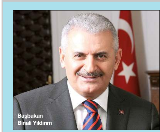
Başbakan Binali Yıldırım