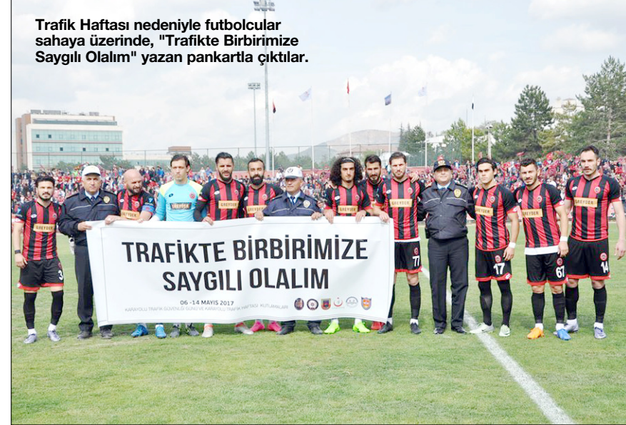
Trafik Haftası nedeniyle futbolcular sahayı üzerinde, "Trafikte Birbirimize Saygılı Olalım" yazan pankartla çıktılar.

Çorum Belediyespor, İzmir deplasmanında oynayacağı Altay maçı için Pazar sabahı yola çıkacak. Pazar sabah 08.00'de karayoluyla Ankara'ya hareket edecek olan katile buradan da 12.05 uçağıyla İzmir'e hareket edecek. İzmir Bayraklı'da bulunan Hilton Otel'de kampa girecek olan Kırmızı-Siyahlılar, Pazartesi günü oynayacağı maçın ardından 21.40 uçağıyla Ankara'ya inecek. Katilem, Ankara'dan da karayoluyla tekrar Çorum'a dönecek.