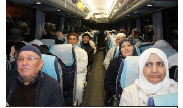
Sungurlu'dan kutsal topraklara gidecek olan 108 kişilik umre kafilesi için Çarşıbaşı Camii önünde uğurlama töreni düzenlendi.

ilk önce Medine daha sonra Mekke'yi ziyaret edip 28 Şubatta yurda döneceklerini söyledi.