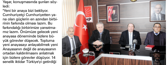
Sungurlu Belediyesi'nin ücretsiz sıcak çorba ikramı başladı.