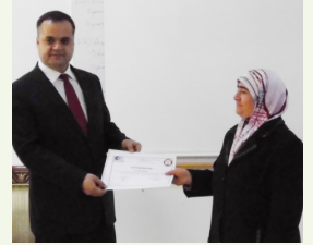
fendileri tebrik ediyorum ve belgelerin hayırlı olmasını diliyorum" dedi.