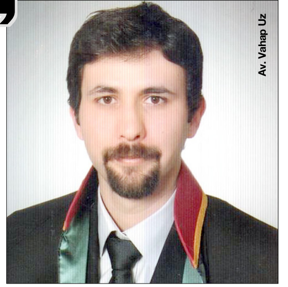
Av. Vahap Uz

Günümüze baktığımızda ise, adı 'Savaş' olmasa da, insanların etnik köken, düşünce ve/veya siyasi kimliği nedeniyle hala en temel insan hakkı olan yaşam hakkının ellerinden alındığını üzümlerle seyretmekteyiz. Ülkemizde 15 Temmuz'da cereyan eden darbe girişiminin, ülkemize ve demokrasimize vermiş olduğu yaranın sancısı halen çekilmektedir. En temel insan haklarından olan seçme ve seçilme hakkına silahla darbe vurulmaya çalışılmıştır. Bu duruma karşı TBMM'nin verdiği tepki tüm Dünya'ya örnek olmuş ve Meclisimizin önemi daha da ortaya çıkmıştır. Ancak akabinde ilan edilen OHAL ve çıkarılan KHK lar Meclisin tarihi davranışını gölge de bırakmaya başlamıştır. Söz konusu darbe girişiminin faillerinin yarılınması ve derhal cezalandırılması yanında, Ülkemizin yönetsel ve hukuksal olarak normale dönme ihtiyacı da zaruri olmuştur. Bu durumun ise tüm ülke insanlarına ayrım gözetmeksizin, eşit, tarafsız adalet dağıtımını gerçekleştireceği kuşkusuzdur. Adaletin sağlanması açısından savunma görevi gören avukatların haklarına ve taleplerine daha da fazla değer verilmesi gerek-