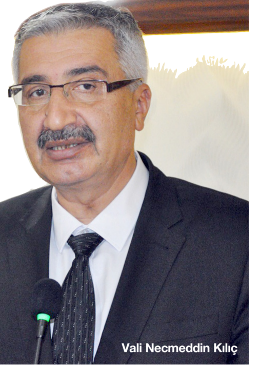
Vali Necmeddin Kılıç

Vali Necmeddin Kılıç, Ulu Önder Mustafa Kemal Atatürk'ün vefatının 78. Yılı dönümü nedeniyle yazılı bir basın açıklaması yayınladı.