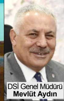
DSİ Genel Müdürü Mevüt Aydın

118 bin 350 dekar zirai arazinin sulanmasını sağlayacak Çorum Koçhisar Sulaması ve Osmancık ilçe merkezinin içme ve kullanma suyu ihtiyacını karşılayacak olan Osmancık Dereboğazı Barajı tamamlandı. Devlet Su İşleri (DSİ) Çorum'a yaptığı yatırımlarla mübit toprakları su ile buluşturmaya, vatandaşlara içme ve kullanma suyu temin etmeye ve derelerdeki taşkın riskini azaltmaya devam ediyor. Çorum'da ve ilçelerinde son dönemde yapılan su yapılarının artması bölgedeki tarımsal faaliyetlerin gelişmesinde önemli rol oynamakta. Büyük sulama projeleri alanları dışında kalan kırsal kesimlerde kısa sürede sulu tarıma geçilmesi ve civardaki içme kullanma suyu ihtiyaçlarının karşılanması hedeflenen "GÖLSU" projesi kapsamında Çorum ve ilçeleri de nasibini aldı. 5'DE