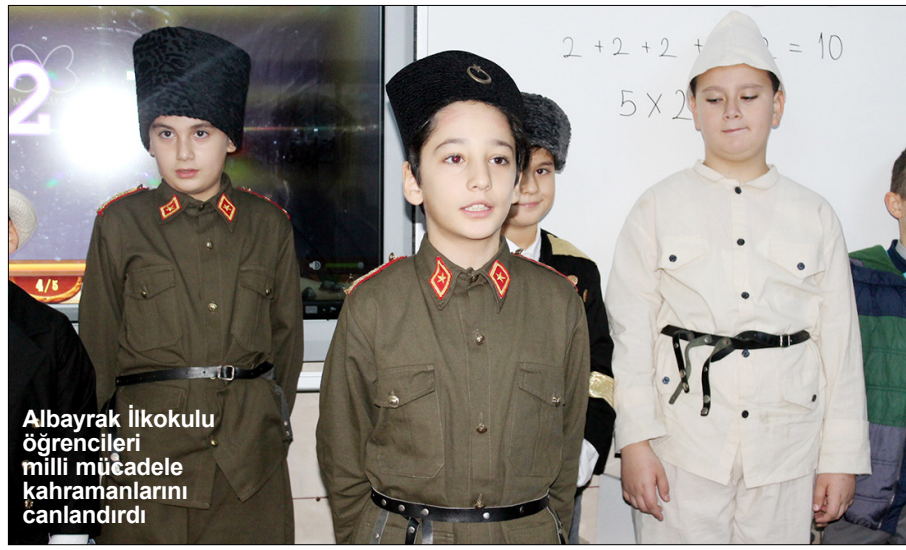
Albayrak İlkokulu öğrencileri milli mücadele kahramanlarını canlandırdı

Glütensiz diyet uygulayan yada glütensiz yiyecek yiyen kişiler için ideal bir besindir. Glütensiz diyet uygulayan kişilerin dışında çölyak hastalığı olan kişiler de glüten içermeyen yiyecekler tüketmelidir. Kinoa glüten içermemesi sebebiyle çölyak hastaları için de ideal bir besindir. Yulaf gevreği tüketmeyen kişiler kinoa gevreği tüketebilir.