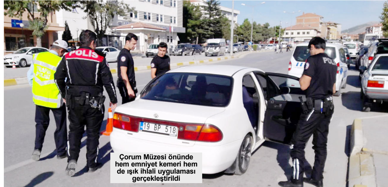
Çorum Müzesi önünde hem emniyet kemeri hem de ışık ihlali uygulaması gerçekleştirildi

Çorum'da trafik kurallarına uymayan sürücülere adeta ceza yağdı. Kentte emniyet kemeri kullanımının yaygınlaşması ve ışık ihlali yapan sürücülerin tespit edilmesi amacıyla Trafik Bölge Denetim Şube Müdürlüğü'nce yapılan çalışmalar devam ediyor. Bu kapsamda şehrin bilinen yerlerinde denetimler yapılıyor. Dün Çorum Müzesi önünde hem emniyet kemeri hem de ışık ihlali uygulaması gerçekleştirildi. Havadan drone desteğiyle yapılan denetimlerde kırmızı ışık ihlali yapan ve emniyet kemeri takmayanlara adeta ceza yağdı. 3'DE