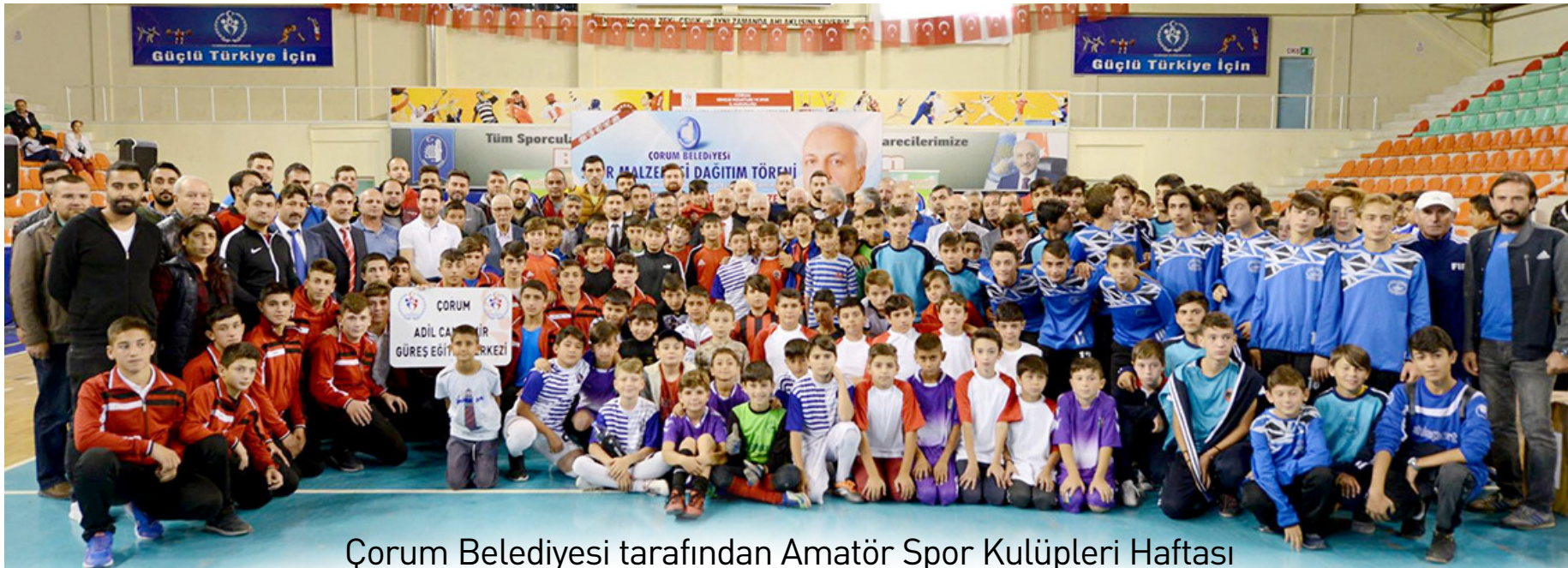
Çorum Belediyesi tarafından Amatör Spor Kulüpleri Haftası kapsamında 54 kulübe 20 branşta 5 bin 88 adet malzeme düzenlenen törenle dağıtıldı