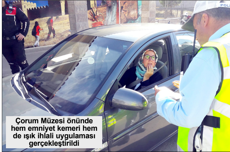
Çorum Müzesi önünde hem emniyet kemeri hem de ışık ihlali uygulaması gerçekleştirildi