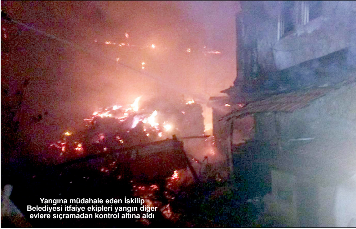
Yangına müdahale eden İskilip Belediyesi itfaiye ekipleri yangın diğer evlere sıçramadan kontrol altına aldı

İskilip ilçesinde çıkan yangında 2 ev kül oldu.