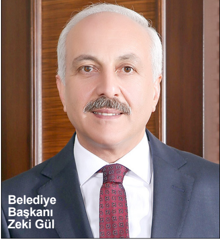
Belediye Başkanı Zeki Gül

Cumartesi günü saat 10.00'da gerçekleştirilecek Çorum Belediyesi Karakuçak Güreşleri'ne bütün Çorumluları davet etti. (Haluk Söylemez)