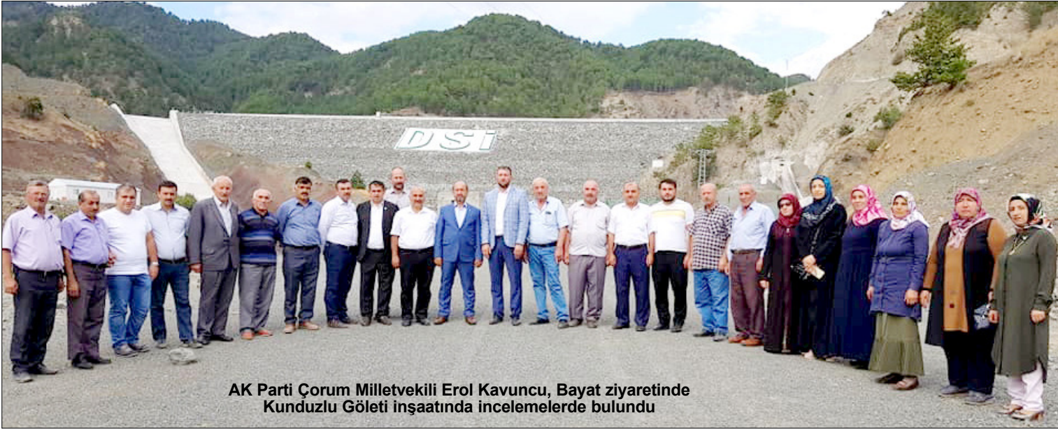
AK Parti Çorum Milletvekili Erol Kavuncu, Bayat ziyaretinde Kunduzlu Göleti inşaatında incelemelerde bulundu