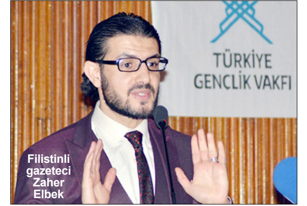
Filistinli gazeteci Zاهر Elbek