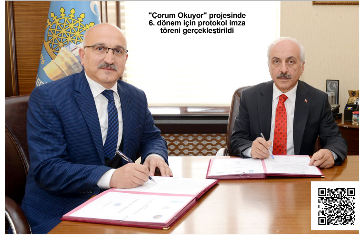
"Çorum Okuyor" projesinde 6. dönem için protokol imza töreni gerçekleştirildi