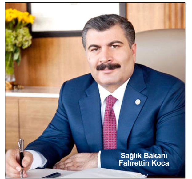
Sağlık Bakanı Fahrettin Koca

"Sağlık Bakanlığı olarak ekonomik dalgalanmaların herhangi bir şekilde sağlık hizmetlerini, dolayısıyla vatandaşlarımızın sağlığını etkilememesi için gerekli tedbirleri almış olduğumuz hususunda kamuoyunu bilgilendiririz." (Haber Merkezi)