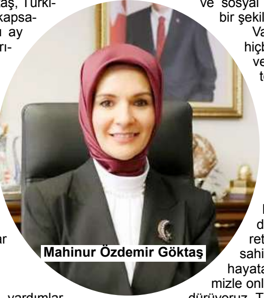
Mahinur Özdemir Göktaş

Bakan Göktaş, açıklamasında, bu ayki ödemeye birlikte sağlanan toplam desteğin 68,3 milyar liraya ulaşacağını bildirdi.