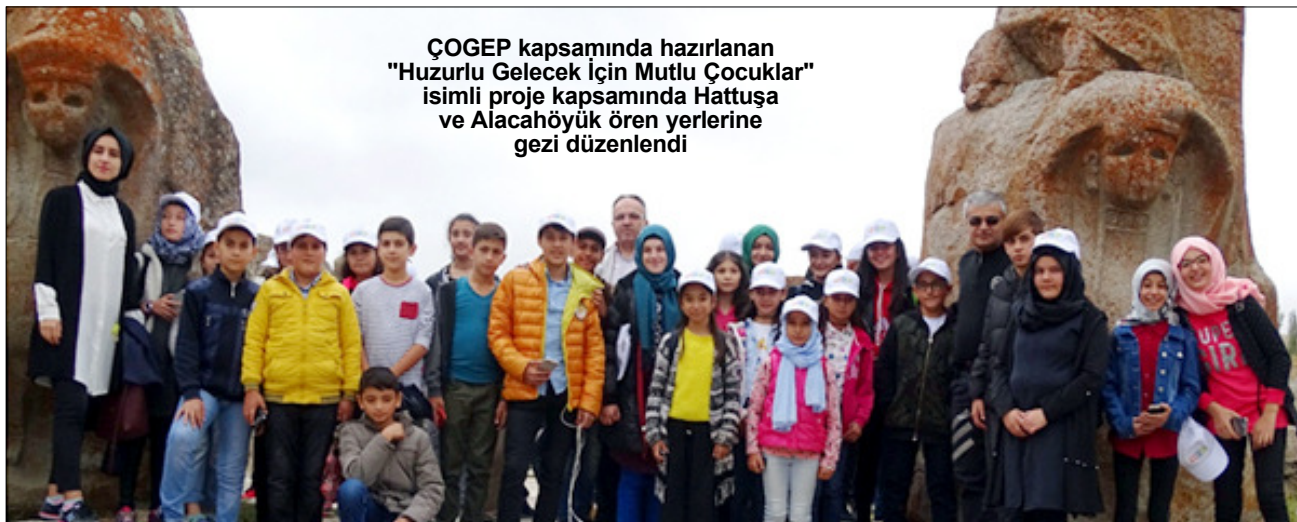
ÇOGEP kapsamında hazırlanan "Huzurlu Gelecek İçin Mutlu Çocuklar" isimli proje kapsamında Hattuşa ve Alacahöyük ören yerlerine gezi düzenlendi

İl Emniyet Müdürlüğü, çocuk ve gençlerin sosyal ile kültürel gelişimlerine yönelik düzenlediği faaliyetlere devam ediyor. Çorum Emniyet Müdürlüğü, Toplum Destekli Polislik Şube Müdürlüğü tarafından Çocuk ve Gençler Sosyal Koruma ve Destek Programı (ÇOGEP) kapsamında hazırlanan, "Huzurlu Gelecek İçin Mutlu Çocuklar" isimli proje kapsamında Hattuşa ve Alacahöyük ören yerlerine gezi düzenlendi. İl Millî Eğitim Müdürlüğü'nün koordinesinde üç grup halinde 9, 10, 11 Ekim tarihlerinde gerçekleştirilen geziye Çorum il merkezinde öğrenim gören 200 öğrenci katıldı. 2'DE