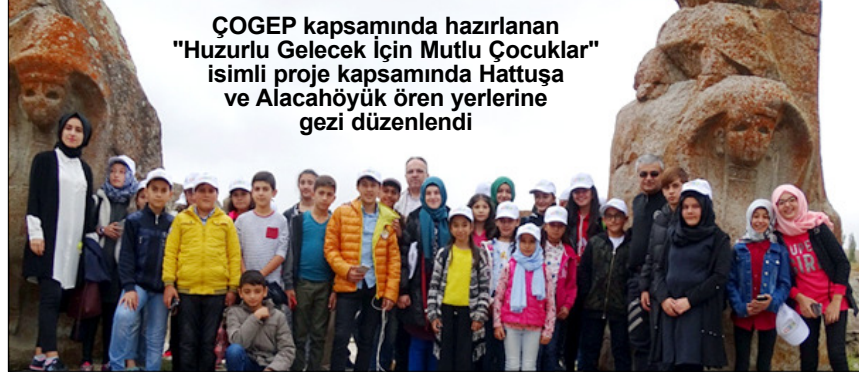
ÇOGEP kapsamında hazırlanan "Huzurlu Gelecek İçin Mutlu Çocuklar" isimli proje kapsamında Hattuşa ve Alacahöyük ören yerlerine gezi düzenlendi

Gezide öğrencilere Alaca ve Boğazkale de bulunan Hitit döneminden kalma tarihi ören yerleri İl Kültür Turizm Müdürlüğü tarafından görevlendirilen rehber eşliğinde, tarih bilincinin geliştirilmesi, sosyal ve kültürel gelişimlerine katkı sağlamak amacıyla gezdirildi. (Haber Merkezi)