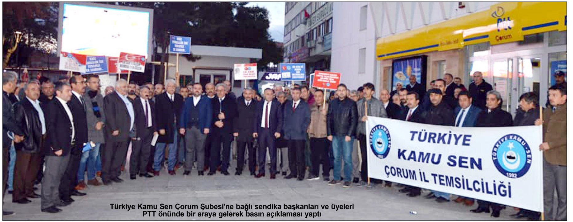
Türkiye Kamu Sen Çorum Şubesi'ne bağlı sendika başkanları ve üyeleri PTT önünde bir araya gelerek basın açıklaması yaptı

Romatizma, böbrek hastalığı ve gut hastalığı olan kişilerin yemesi tavsiye edilmez.