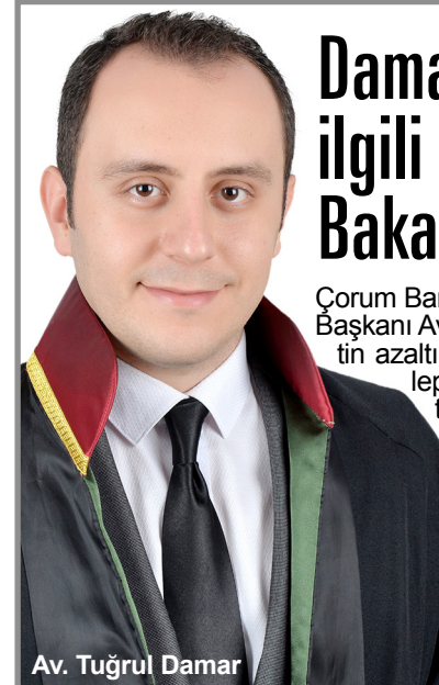
Av. Tuğrul Damar