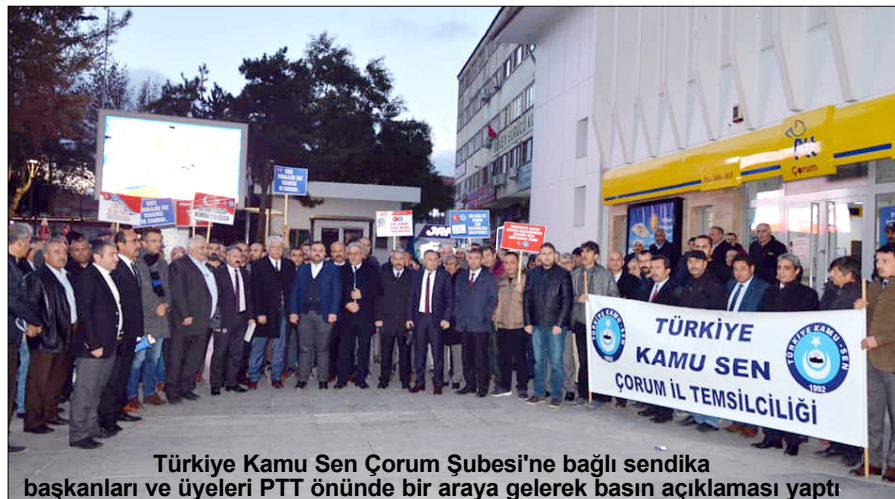
Türkiye Kamu Sen Çorum Şubesi'ne bağlı sendika başkanları ve üyeleri PTT önünde bir araya gelerek basın açıklaması yaptı

Türkiye Kamu Sen İl Temsilciliğine bağlı sendikalar, memurlar için ek zam talebini içeren mektupları Cumhurbaşkanı Recep Tayyip Erdoğan'a gönderdi. Türkiye Kamu Sen tarafından 81 ilde memurların ek zamlarıyla ilgili talepleri dile getirmek amacıyla basın açıklamaları, mektuplar ve eylemler düzenlendi. Çorum'da da Türkiye Kamu Sen Çorum Şubesi'ne bağlı sendika başkanları ve üyeleri dün PTT önünde bir araya gelerek basın açıklaması yaptı. 6'DA