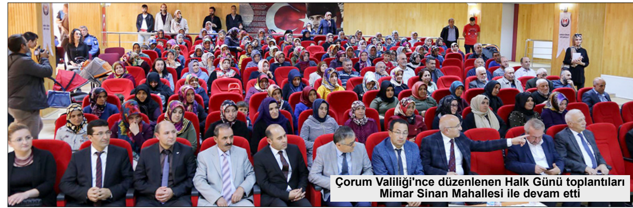
Çorum Valiliği'nce düzenlenen Halk Günü toplantıları Mimar Sinan Mahallesi ile devam etti