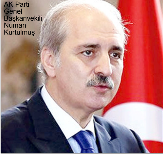
AK Parti Genel Başkanvekili Numan Kurtulmuş