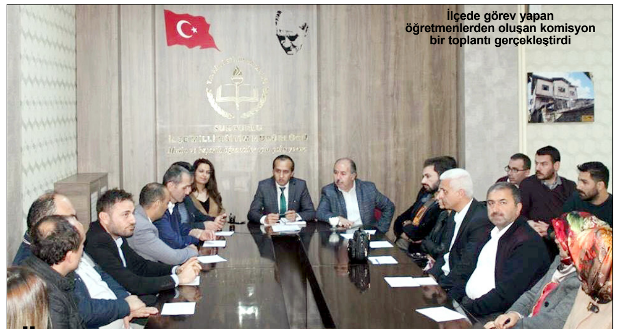
İlçede görev yapan öğretmenlerden oluşan komisyon bir toplantı gerçekleştirdi

16 bin 703 metrekarelik bir alana yapılan Kentpark için belediye ekipleri çalışmalarını sürdürüyor