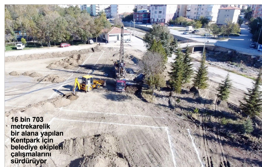
16 bin 703 metrekaarelik bir alana yapılan Kentpark için belediye ekipleri çalışmalarını sürdürüyor

Sungurlu Belediyesi tarafından yapılan Kent Park için çalışmalar aralıksız devam ediyor. Eski stadyumun bulunduğu alanı ve eski şehir parkıyla stadyumun arasında kalan yolu içine alacak şekilde 16 bin 703 metrekaarelik bir alana yapılan Kent parkı için belediye ekipleri hummalı bir şekilde çalışmalarını sürdürüyor. 2 bin adet ağaç dikilecek ve yaklaşık 5 bin civarında küçük bitki ile ağaçlandırma çalışması yapılacak Kent parkta 7 bin metrekaarelik alan ise rulo çim ile çimlendirilecek. 2'DE