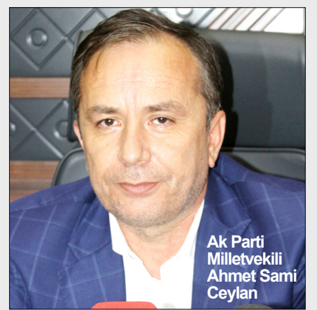
Ak Parti Milletvekili Ahmet Sami Ceylan