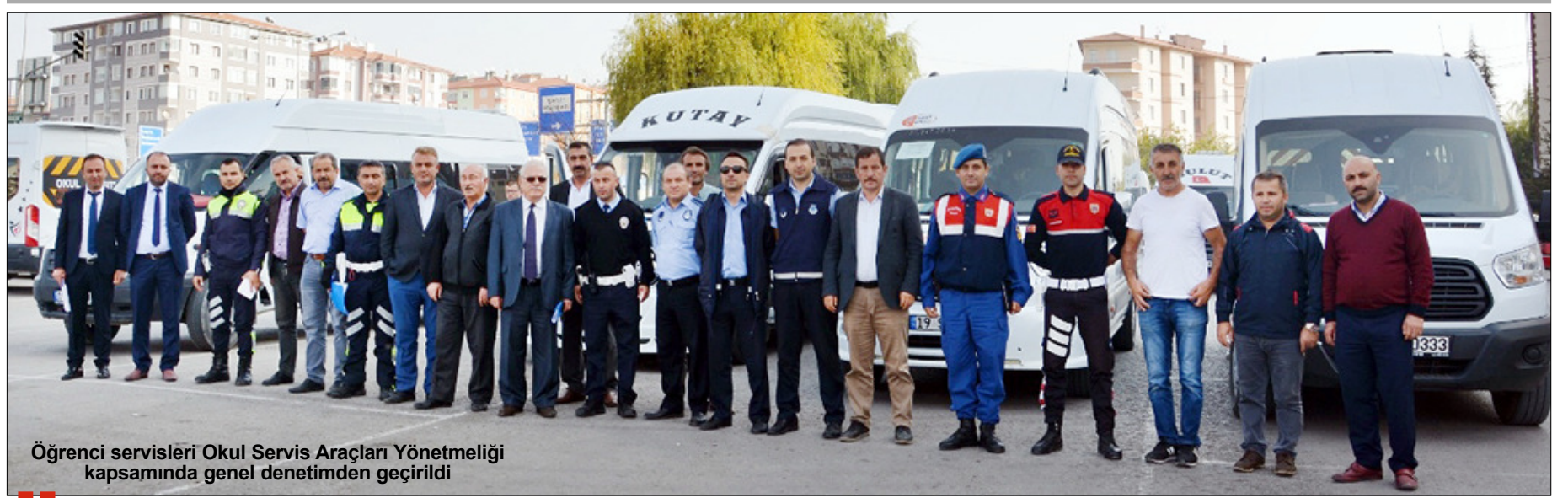
Öğrenci servisleri Okul Servis Araçları Yönetmeliği kapsamında genel denetimden geçirildi

TÜİK Samsun Bölge Müdürlüğünden yapılan açıklamaya göre Çorum'da toplam konut satışları içinde ilk satışların payı %54,8 iken; ikinci el satışlarının payı ise %45,2 olarak gerçekleşti. Türkiye genelinde ise konut satışları içinde ilk satışın payı %47,3, ikinci el satışlarının payı ise %52,7 oldu. (Haluk Söylemez)