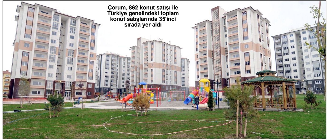
Çorum, 862 konut satışı ile Türkiye genelindeki toplam konut satışlarında 35'inci sırada yer aldı

satılan konutların ipotekli olarak satıldığı ve ipotekli satış oranının en fazla olduğu iller sıralamasına göre 17'inci sırada yer aldı. Çorum'da 2018 yılı Eylül ayı itibarıyla bir önceki yılın aynı ayına göre ipotekli satılan konut sayısı %63,6 oranında azaldı.