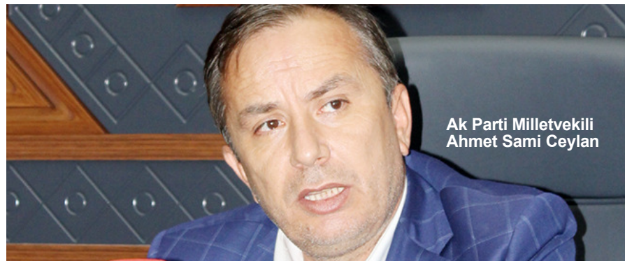
Ak Parti Milletvekili Ahmet Sami Ceylan

Açıklamasında Çorum ve ilçelerinde bulunan tüm köy ile mahalle muhtarlarının 19 Ekim Muhtarlar Günü'nü kutlayan AK Parti Milletvekili Ceylan, "Köyerimize ve mahallelerimize kamu kaynaklarının sağlıklı aktarılması için büyük bir sorumluluk bilinci ile devletimiz ile milletimiz arasında köprü görevi