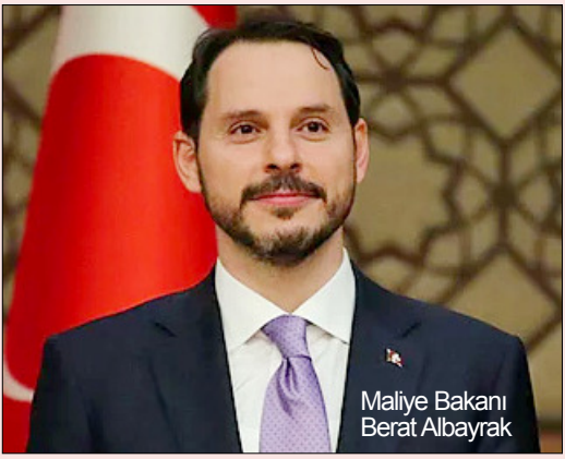
Maliye Bakanı Berat Albayrak