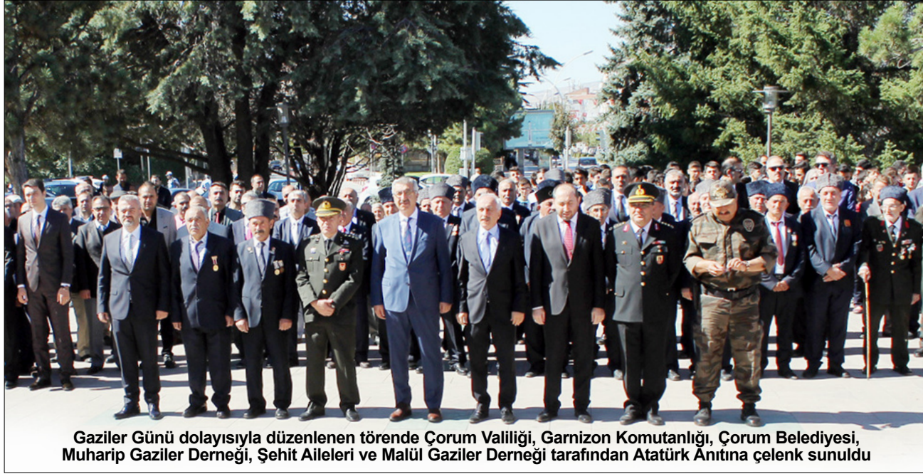
Gaziler Günü dolayısıyla düzenlenen törende Çorum Valiliği, Garnizon Komutanlığı, Çorum Belediyesi, Muharip Gaziler Derneği, Şehit Aileleri ve Malül Gaziler Derneği tarafından Atatürk Anıtına çelenk sunuldu