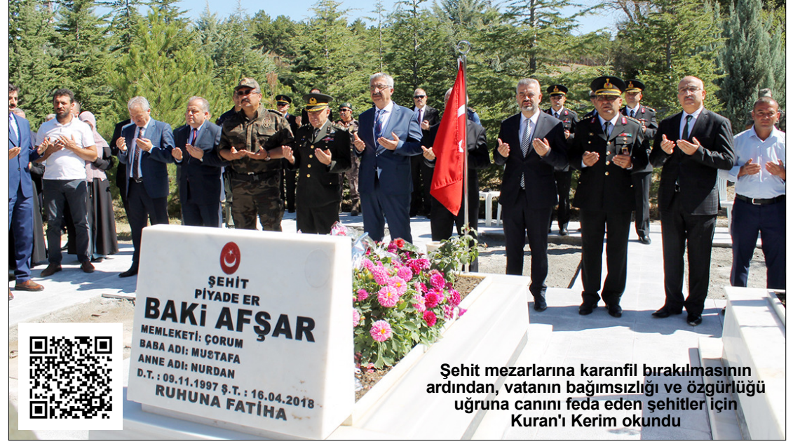
Şehit mezarlarına karanfil bırakılmasının ardından, vatanın bağımsızlığı ve özgürlüğü uğruna canını feda eden şehitler için Kur'an'ı Kerim okundu

Şehit mezarlarına karanfil bırakılmasının ardından, vatanın bağımsızlığı ve özgürlüğü uğruna canını feda eden şehitler için Kur'an'ı Kerim okundu. Ziyaret İl Müftüsü Ahmet Akın'ın yaptığı dua ile sona erdi. (Çağrı UZUN)