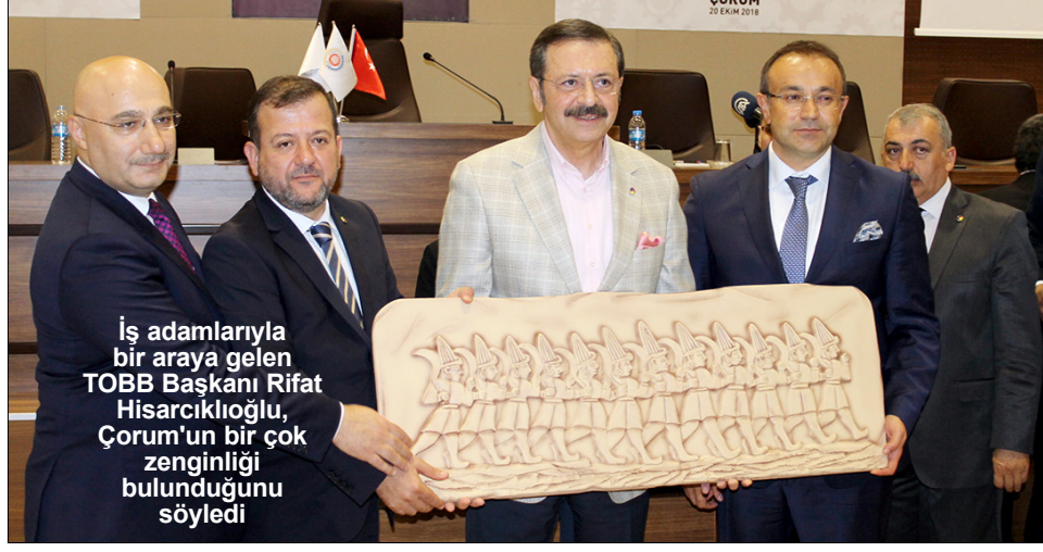
İş adamlarıyla bir araya gelen TOBB Başkanı Rifat Hisarcıkloğlu, Çorum'un bir çok zenginliği bulunduğunu söyledi

Çorum'un tarihi ve kültürel değerlerine de değinen Hisarcıkloğlu, "Çorum aynı zamanda kültür ve turizm şehri. Hattuşa, Alacahöyük gibi zenginlikleriyle Çorum adeta açık hava müzesi gibidir. Bugün Çorum artık bir sanayi şehri haline geldi. Hızlı tren projesi ve otoyol projesi sayesinde Çorum, İç Anadolu'yu Karadeniz'e bağlayacak. Bütün dünyadaki şehirler hep