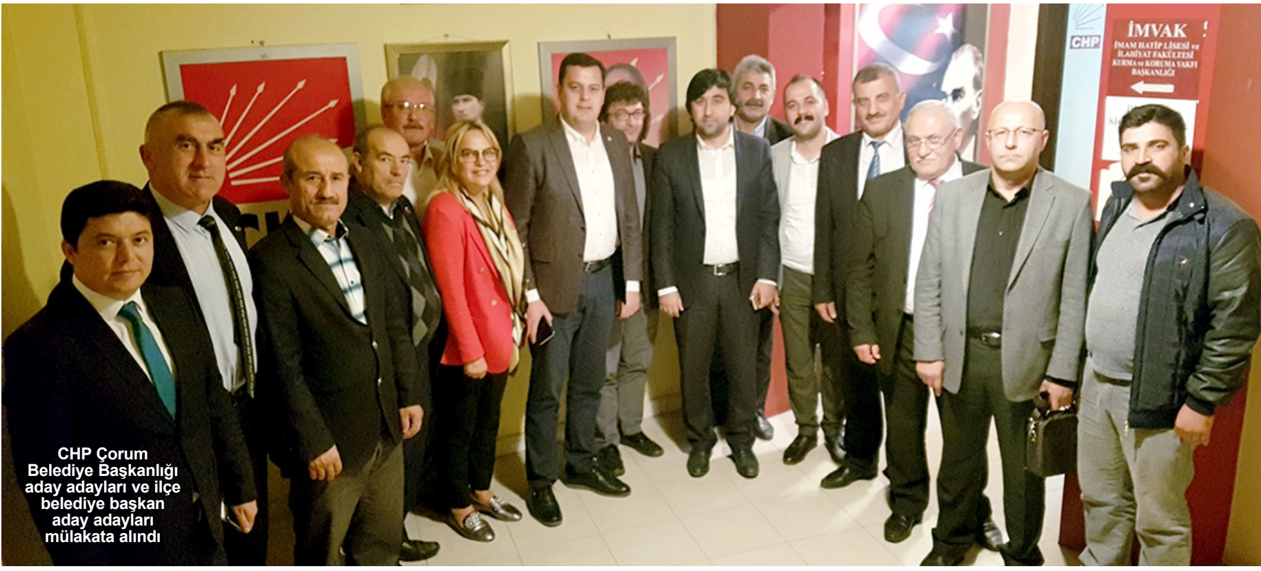
CHP Çorum Belediye Başkanlığı aday adayları ve ilçe belediye başkan aday adayları mülakata alındı