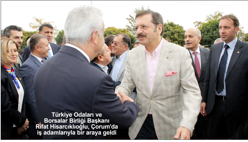
Türkiye Odaları ve Borsalar Birliği Başkanı Rifat Hisarcıkloğlu, Çorum'da iş adamlarıyla bir araya geldi

Burada bir konuşma yapan TOBB Başkanı Rifat Hisarcıkloğlu, Türkiye'de ekonomide yaşanan sorunlara ilişkin, "Bu tekerlek