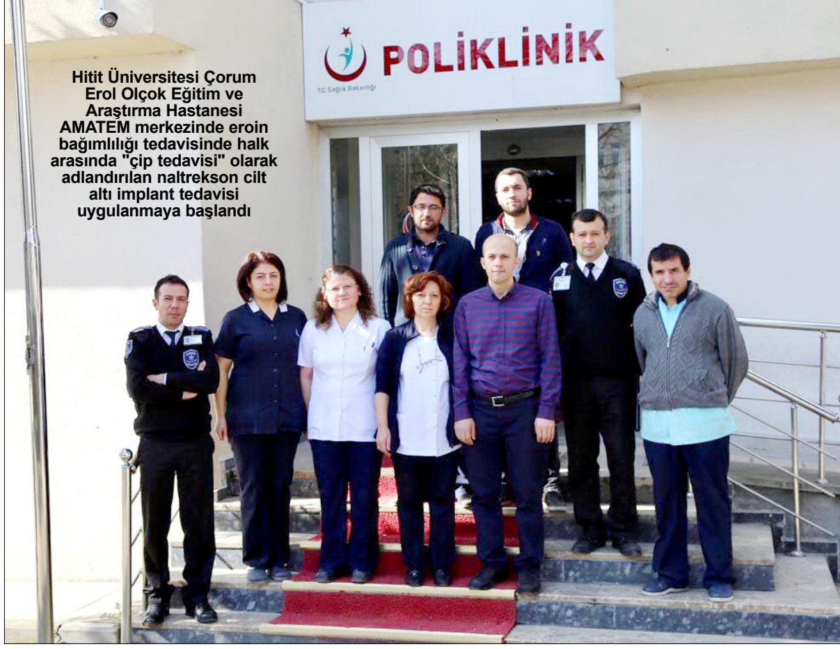
Hitit Üniversitesi Çorum Erol Olçok Eğitim ve Araştırma Hastanesi AMATEM merkezinde eroin bağımlılığı tedavisinde halk arasında "çip tedavisi" olarak adlandırılan naltrekson cilt altı implant tedavisi uygulanmaya başlandı

Alkol ve Madde Bağımlılığı Tedavi Merkezi'nde (AMATEM), Çip Tedavisi'ne başlandı.