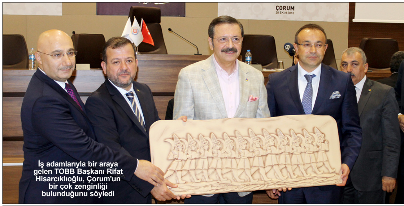
İş adamlarıyla bir araya gelen TOBB Başkanı Rifat Hisarcıkloğlu, Çorum'un bir çok zenginliği bulunduğunu söyledi

TOBB Başkanı Rifat Hisarcıkloğlu, Samsun, Çorum, Kırıkkale, Ankara hızlı tren projesi ve otoyol projeleriyle Çorum'un İç Anadolu'yu Karadeniz'e bağlayacak önemli bir güzergah haline geleceğini söyledi. Türkiye Odalar ve Borsalar Birliği (TOBB) Başkanı Rifat Hisarcıkloğlu, Çorum'un geleceğinin oldukça parlak olduğunu söyledi. Geçtiğimiz Cumartesi günü Çorum'a gelerek Ticaret Borsası Başkanı Naki Özkubat, yeni TSO binası ve Halkbankası Bölge Müdürlüğü'nün hayırlı olmasını temennisinde bulundu. Bakan Berat Albayrak'ın Topyekun Enflasyonla Mücadele kampanyası kapsamında bir haftadır üyelerle görüştüklerini dile getiren Özkubat, "Üyelerimizin hepsinin mücadeleye katılma hevesi beni duygulandırdı. Biz milletçe başaracağız, başaracağız" dedi. 5'DE