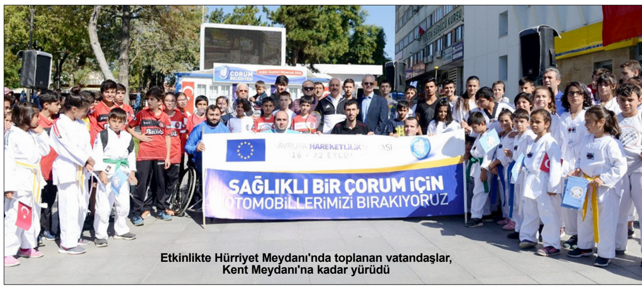
Etkinlikte Hürriyet Meydanı'nda toplanan vatandaşlar, Kent Meydanı'na kadar yürüdü

Avrupa Birliği (AB) tarafından Çorum Belediyesi'nin de katkılarıyla Çorum'da kutlanan Avrupa Hareketlilik Haftası kapsamında "Otomobilsiz Kent Günü" etkinliği düzenlendi. AB Parlamentosu tarafından halk sağlığını ve yaşam kalitesini iyileştirmek, sağlıklı yaşama dikkat çekmek amacıyla 2002 yılından bugüne 16-22 Eylül tarihleri arasında düzenlenen "Avrupa Hareketlilik Haftası" etkinliklerine bu yıl Çorum ev sahipliği yaptı. Etkinlikler kapsamında geçtiğimiz Cumartesi günü "Otomobilsiz Kent Günü" etkinliği gerçekleştirildi. 2'DE