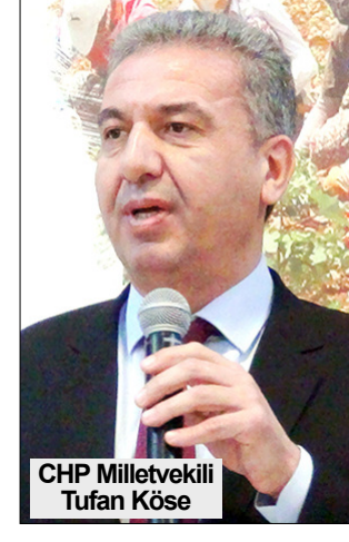
CHP Milletvekili Tufan Köse