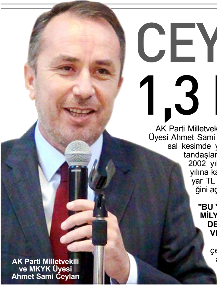
AK Parti Milletvekili ve MKYK Üyesi Ahmet Sami Ceylan