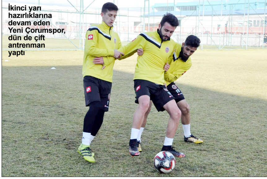
İkinci yar hazırlıklarına devam eden Yeni Çorumspor, dün de çift antrenman yaptı