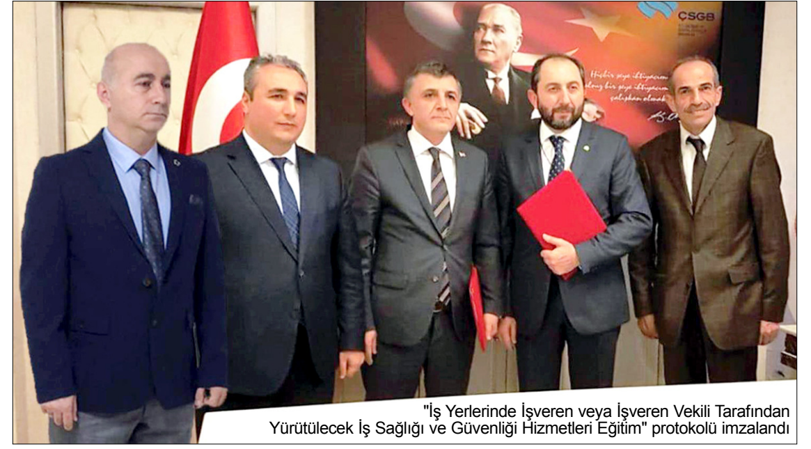
"İş Yerlerinde İşveren veya İşveren Vekili Tarafından Yürütülecek İş Sağlığı ve Güvenliği Hizmetleri Eğitim" protokolü imzalandı