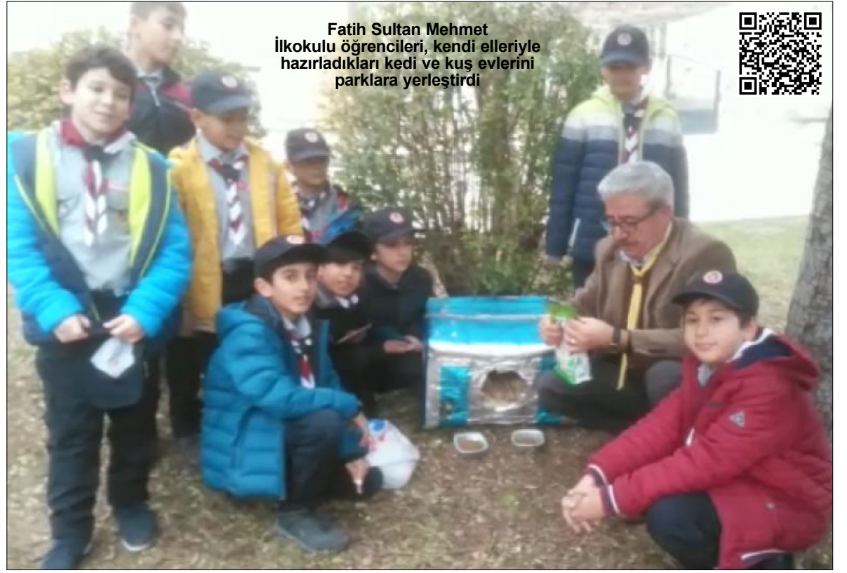
Fatih Sultan Mehmet İlkokulu öğrencileri, kendi elleriyle hazırladıkları kedi ve kuş evlerini parklara yerleştirdi