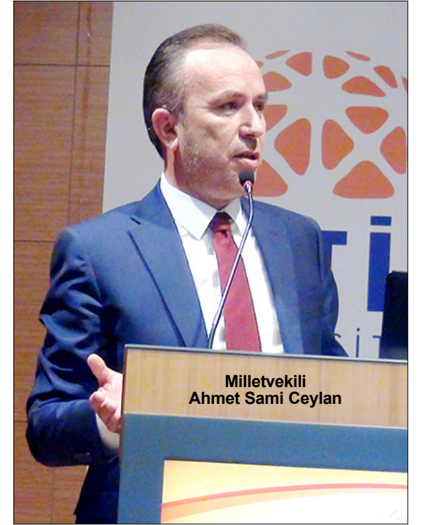
Milletvekili Ahmet Sami Ceylan

Dün gerçekleştirilen törende bir konuşma yapan Milletvekili Ceylan, "Bu öğrencileri istediğimiz gibi kullanım moduna girmeyeceğiz. Bizim sanayicimizin yapacağını tahmin etmiyorum ama bu mantıkla öğrenciye yaklaşsanız verim alamayız. Bu programlar genelde güzel başlıyor. Söylemler de güzel oluyor ama ben işleyişine bakacağım. Burada büyük görev sanayicilerimize düşüyor. Sonuçta bu çocuklara zorla da olsa bir şeyler vermeyi gerekiyor. Bu çocukları kullanalım, ayak işlerini yaptırılmırsak olmaz. 8 bin öğrenciyi yetiştireceğiz. Bu öğrencilerin 3 binini Çorum'da bırakabilirsek heykelinizi dikerim. Ama bırakmamız lazım" diye konuştu. (Çağrı UZUN)