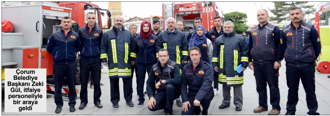
Çorum Belediye Başkanı Zeki Gül, itfaiye personeliyle bir araya geldi

Her yıl 25 Eylül - 1 Ekim tarihleri arasında kutlanan İtfaiyecilik Haftası dolayısıyla Çorum Belediyesi İtfaiye teşkilatı tarafından şant açıldı. Belediye Başkanı Zeki Gül standı ziyaret ederek yetkililerden bilgiler aldı. Ziyarete itfaiye personeliyle görüşen Belediye Başkanı Zeki Gül, burada yaptığı konuşmada, "İtfaiye Teşkilatı bütün dünyada, bütün ülkelerde kurumsallaşmış en yaygın acil durum teşkilatlarından biridir. Kurulduğu ilk yıllarda sadece yangınla mücadele gibi sınırlı bir görev alanına sahip olan İtfaiye Teşkilatı, günümüzde daha geniş bir yelpazede hizmet veren kuruluşlar haline geldi. Şehirlerin büyümesine, gelişmesine bağlı olarak, ortaya çıkan veya çıkma ihtimali bulunan başkaca sorunların çözümü için de çalışan bir teşkilat haline geldi" dedi. 4'DE