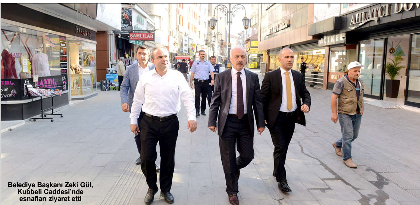
Belediye Başkanı Zeki Gül, Kubbeli Caddesi'nde esnafı ziyaret etti

Çorum Belediye Başkanı Zeki Gül, esnaf ziyaretlerine Kubbeli Caddesi esnafını gezerek devam etti. Esnafı sohbet eden Başkan Gül, hayırlı işler diledi.