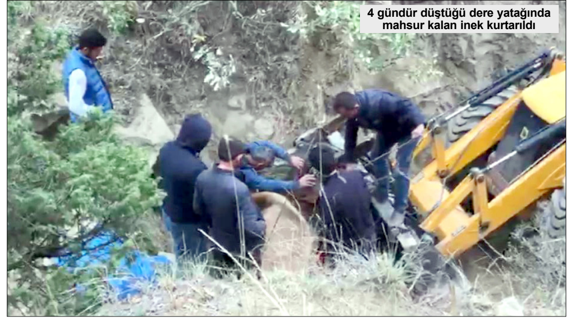
4 gündür düştüğü dere yatağında mahsur kalan inek kurtarıldı

Çorum Belediye Başkanı Zeki Gül durumu haber almasının ardından Özel İdare yetkilileriyle görüşerek kurtarma ope-