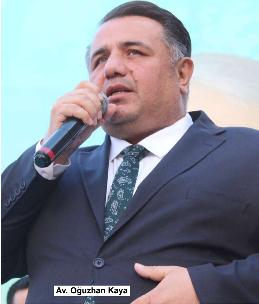
Av. Oğuzhan Kaya