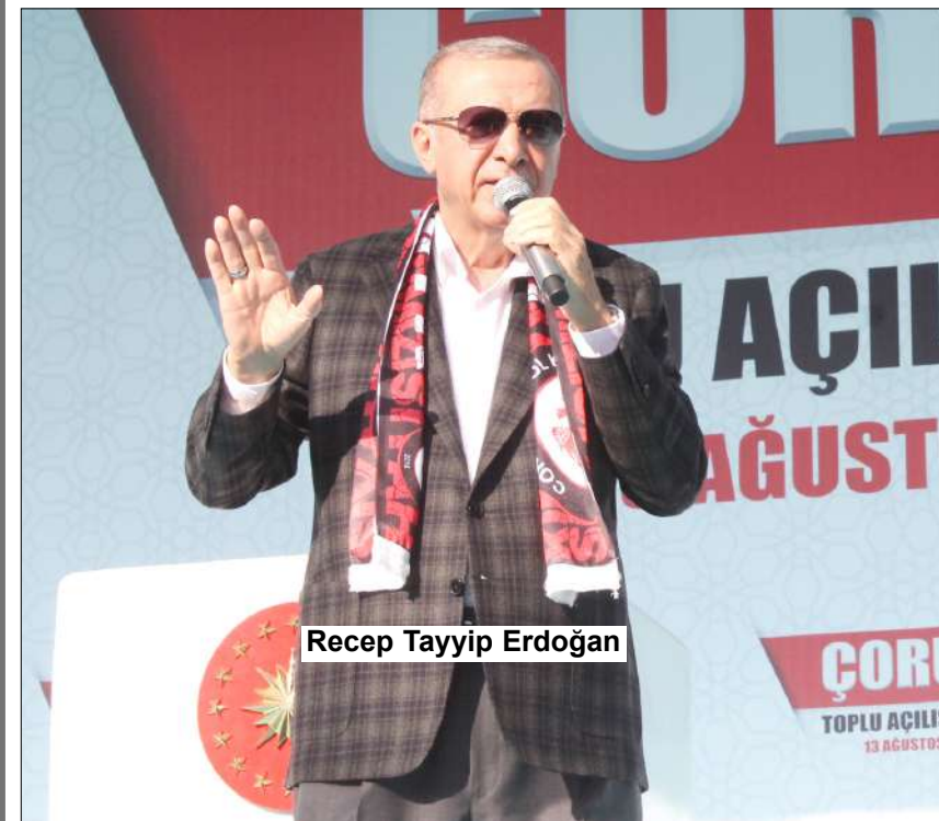
Recep Tayyip Erdoğan

26 Mart'ta Çorum'a gelecek olan Cumhurbaşkanı Recep Tayyip Erdoğan'ın, aynı gün Sungurlu'ya giderek OSB'deki barut fabrikasının açılışını yapacak.