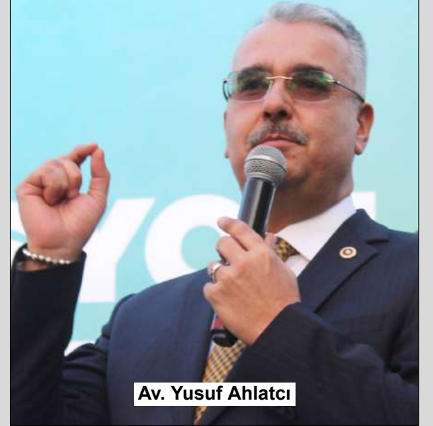
Av. Yusuf Ahlatcı

Cumhur İttifakı'nın Seçim Koordinasyon Merkezi açılışında bir konuşma yapan AK Parti Milletvekili Av. Yusuf Ahlatcı, 31 Mart'ta büyük bir teveccühle seçimleri kazanacaklarını kaydetti. Milletvekili Ahlatcı, "20 yıldır değişmeyen bir hikaye yazıyoruz. 20 yıldır AK Parti'nin ilk belediyesi olan Çorum'da bu bayrağı hiç indirmedik. Cumhur İttifakı'mızın ve Cumhurbaşkanımızın her daim 'kalem' dediği