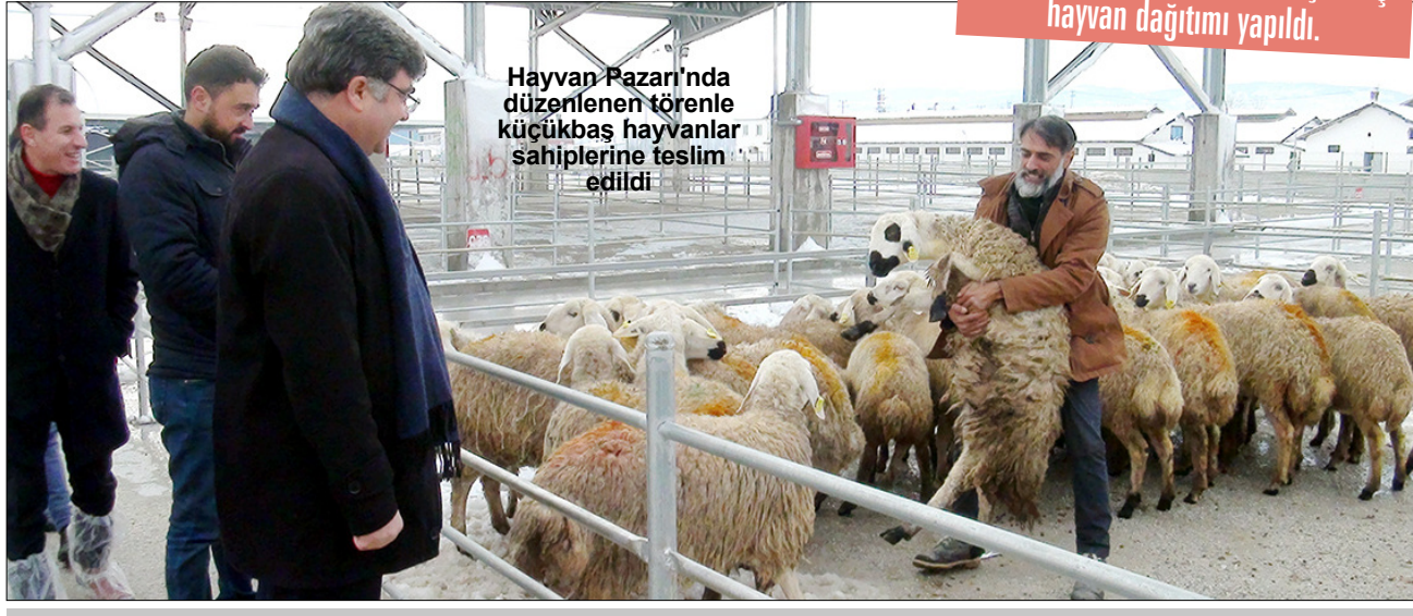
Hayvan Pazarı'nda düzenlenen törenle küçükbaş hayvanlar sahiplerine teslim edildi