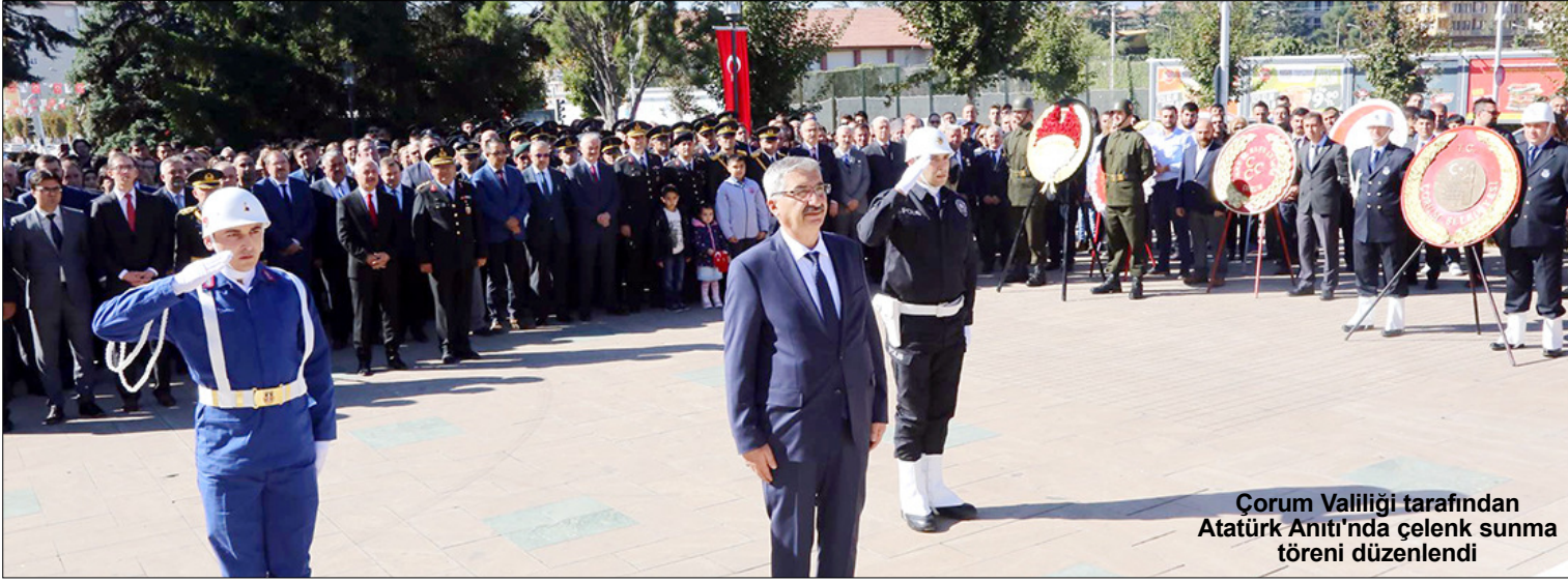
Çorum Valiliği tarafından Atatürk Anıtı'nda çelenk sunma töreni düzenlendi