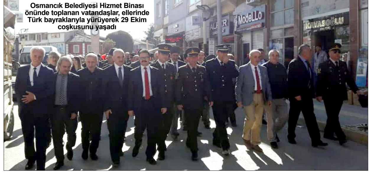
Osmancık Belediyesi Hizmet Binası önünde toplanan vatandaşlar, ellerinde Türk bayraklarıyla yürüyerek 29 Ekim coşkusunu yaşadı