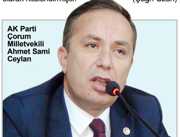
AK Parti Çorum Milletvekili Ahmet Sami Ceylan