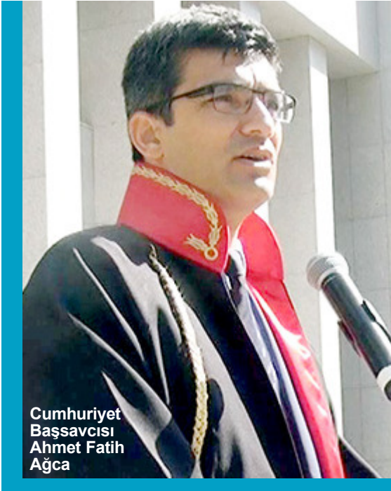
Cumhuriyet Başsavcısı Ahmet Fatih Ağca