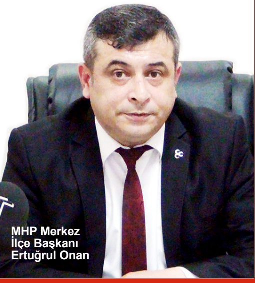
MHP Merkez İlçe Başkanı Ertuğrul Onan