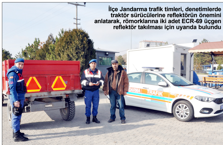
İlçe Jandarma trafik timleri, denetimlerde traktör sürücülerine reflektörün önemini anlatarak, römorklarına iki adet ECR-69 üçgen reflektör takılması için uyarıda bulundu

Yapılan denetimlerde traktör sürücülerine trafik kurallarına uymaları, reflektörsüz karayoluna çıkmaları konusunda uyarılarda bulunan İlçe Jandarma Komutanlığına bağlı Jandarma Trafik timleri, kazaların azaltılması, can ve mal kaybını en aza indirmesi için gece gündüz demeden kararlılıkla uygulamalarını devam ediyor. (İHA)