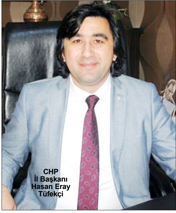
CHP İl Başkanı Hasan Eray Tüfekçi