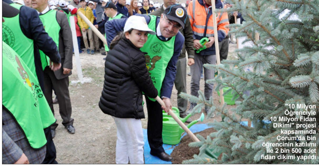
"10 Milyon Öğrenciyle 10 Milyon Fidan Dikimi" projesi kapsamında Çorum'da bin öğrencinin katılımıyla 2 bin 500 adet fidan dikimi yapıldı.