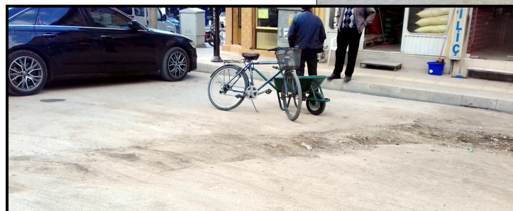
Yapılan kazı çalışmaları ilçenin birçok işlek caddesinde toza neden oluyor

Öte yandan ilçede 4 bin 100 aboneli bulunan Kar Gaz'a, müracaat edip abone olmayı bekleyen 5 bin 660 başvurunun bulunduğu öğrenildi. (Haber Merkezi)