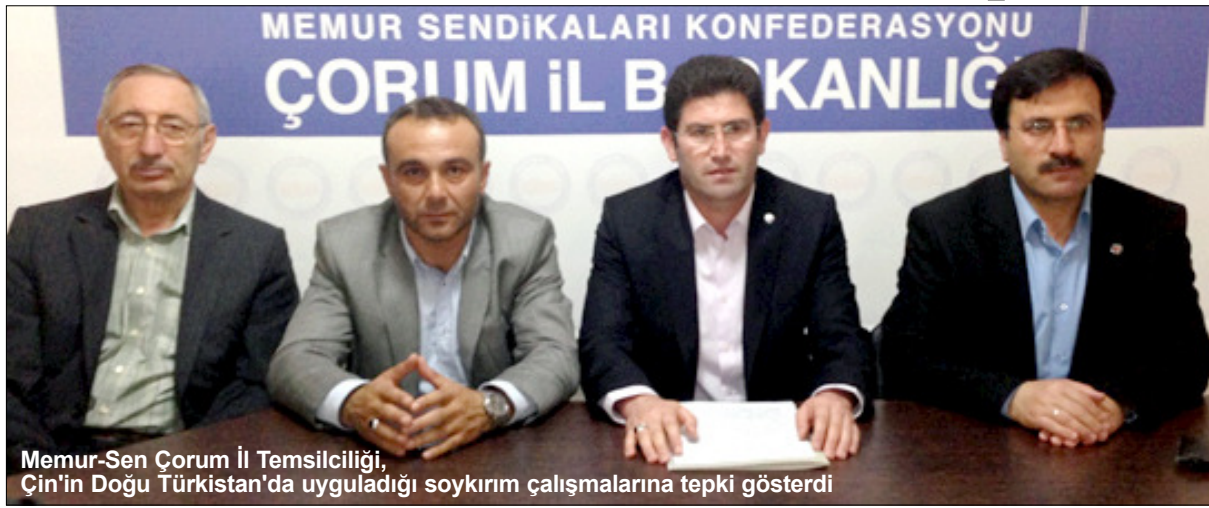
Memur-Sen Çorum İl Temsilciliği, Çin'in Doğu Türkistan'da uyguladığı soykırım çalışmalarına tepki gösterdi

Tabi buradan hemen şu uyarıyı da yapalım; Çin'in Uygur Türklerine uyguladığı soykırımı, son zamanlarda gittikçe şiddetini artıran Amerika-Çin rekabetine politik meze yapmaya çalışanlara izin verilmemeli. Doğu Türkistan ve milyonlarca insan, iki emperyalist devletin çıkar kavgasında araç haline getirilmemeli. Biz bu noktada dünyanın bütün iyi insanlarına, insanlığa önemli vazifeler düştüğüne inanıyoruz. Eğer dünyanın iyi insanları bu konuyu sahiplenip, zulme karşı bir hat oluşturmazsa, Doğu Türkistan başta olmak üzere dünyanın birçok yerinde yaşayan mazlumlar iki zalimden birinin zulmüne maruz kalması kaçınılmazdır. Bu yüzden dünyanın bütün iyi insanların zulme karşı güçlü bir hat oluşturmalı, adalet ve özgürlük dünyamıza hakim kılınmak için sorumluluk al-