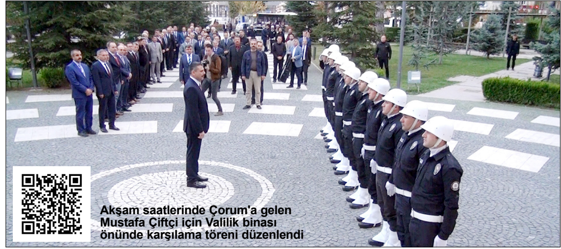
Akşam saatlerinde Çorum'a gelen Mustafa Çiftçi için Valilik binası önünde karşılama töreni düzenlendi

İçişleri Bakanlığı tarafından 30.11.2012 tarihinden geçerli olmak üzere 1.Sınıf Mülki İdare Amirliğine yükseltilen Çiftçi, evli ve üç çocuk babasıdır. (Haluk Söylemez)