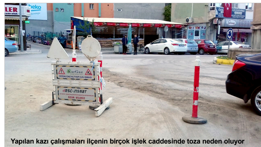
Yapılan kazı çalışmaları ilçenin birçok işlek caddesinde toza neden oluyor

Osmancık'ta bitmek bilmeyen doğalgaz çalışmaları günlük hayatı olumsuz etkiliyor. İlçeye doğalgaz verilisinin 1 yılı aşmasına rağmen halen çalışmalar devam ediyor. Yapılan çalışmalarda Osmancık Belediyesi'nce yapılan asfaltlar sökülerek boru döşeme işlerine devam ediliyor. Yapılan kazı çalışmaları da ilçenin birçok işlek caddesinde toza neden oluyor. 5'DE