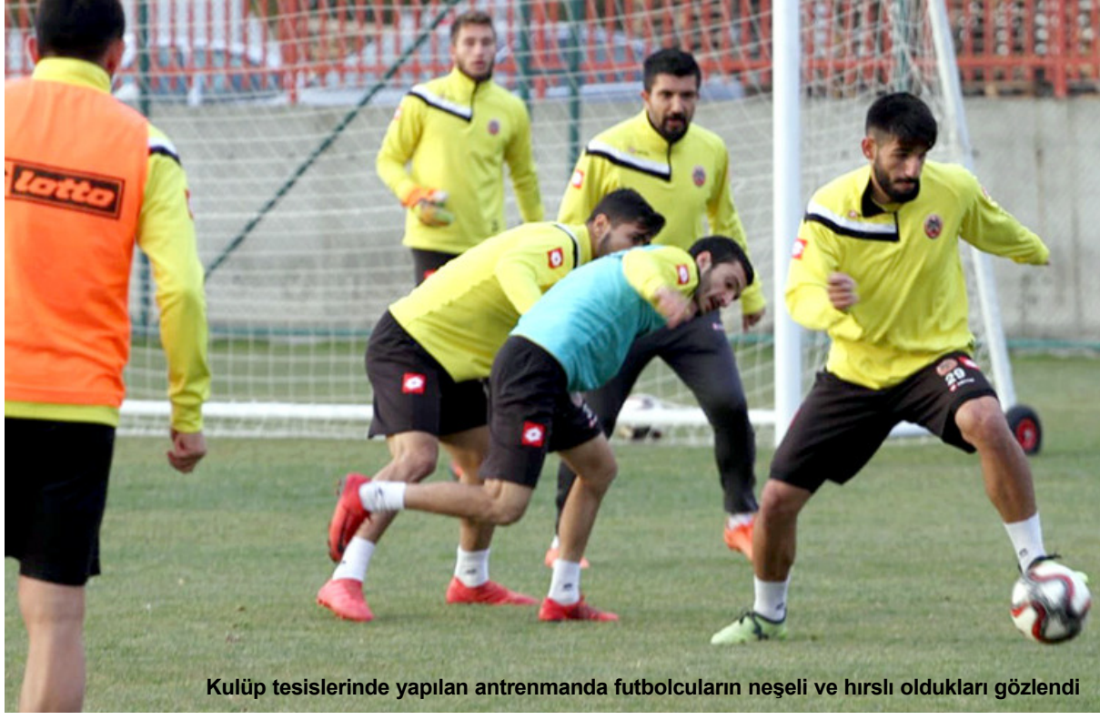
Kulüp tesislerinde yapılan antrenmanda futbolcuların neşeli ve hırslı oldukları gözlemlendi