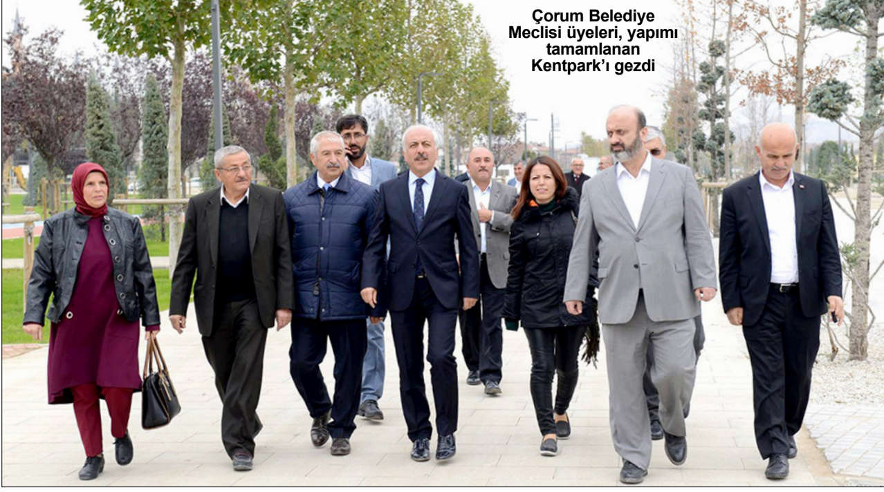
Çorum Belediye Meclisi üyeleri, yapımı tamamlanan Kentpark'ı gezdi