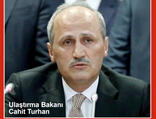
Ulaştırma Bakanı Cahit Turhan