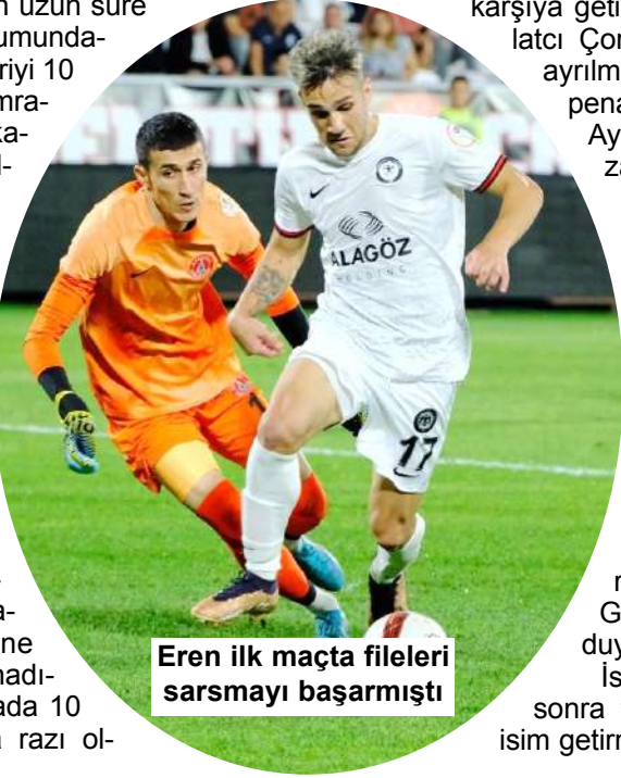
Eren ilk maçta fileleri sarsmayı başarmıştı

Kırmızı-Siyahlılar geride bıraktığımız haftada Ankara deplasmanında Gençlerbirliği'ne konuk olmuş ve iyi oynadığı maçta 58'inci dakikada 10 kişi kalarak bir puana razı olmuştu.