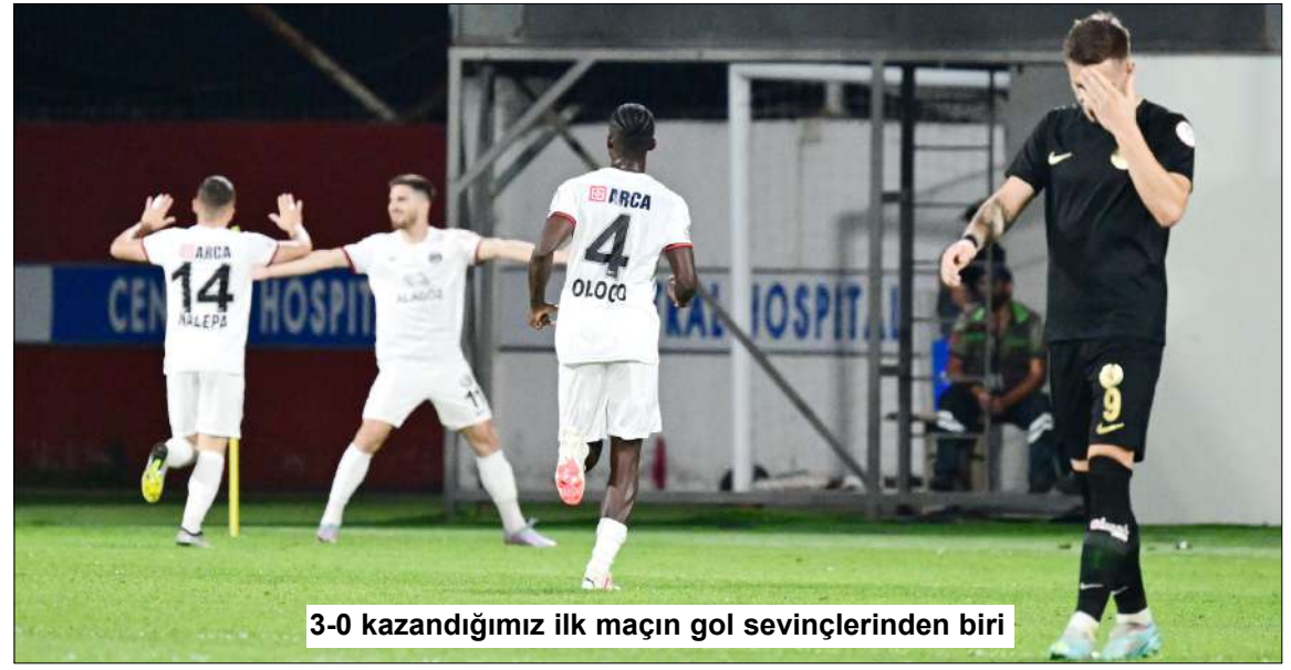
3-0 kazandığımız ilk maçın gol sevinçlerinden biri

İstanbul temsilcisi o maçtan sonra takımın başına henüz bir isim getirmede.