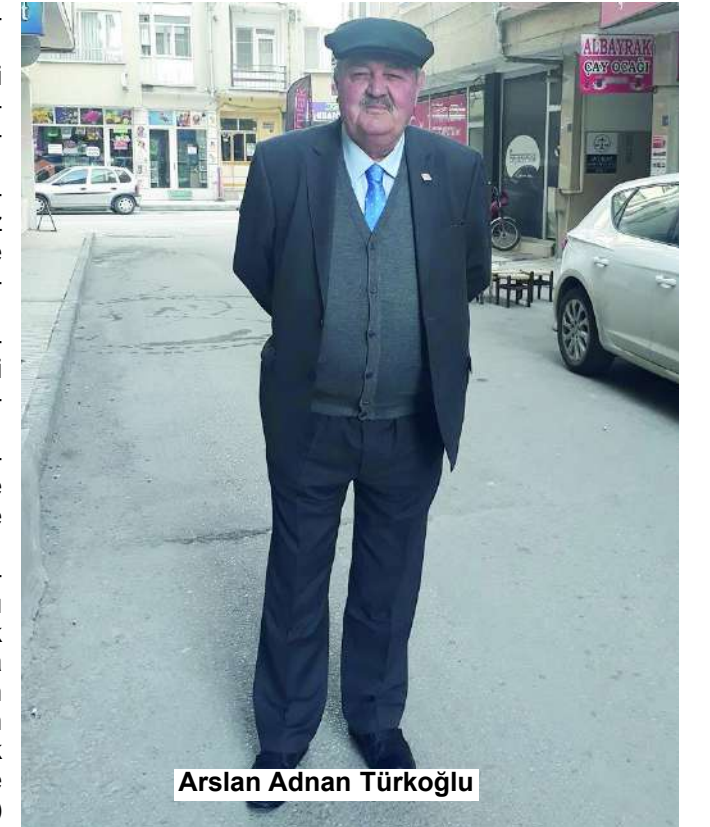
Arslan Adnan Türkoğlu

1991-1995 yılları arasında 4 yıl süreyle Çorum milletvekilliği yapan ve bu dönemde Çorum'a kazandırdığı birçok eserle Çorum'un efsaneleri arasına adını yazdıran Adnan Türkoğlu'nun "Efsane Siyasetçi Mimar Arslan Adnan Türkoğlu" isimli kitabı da Burhan Buruk tarafından yazılmış ve okuyucuları ile buluşturulmuştu. (Haber Merkezi)