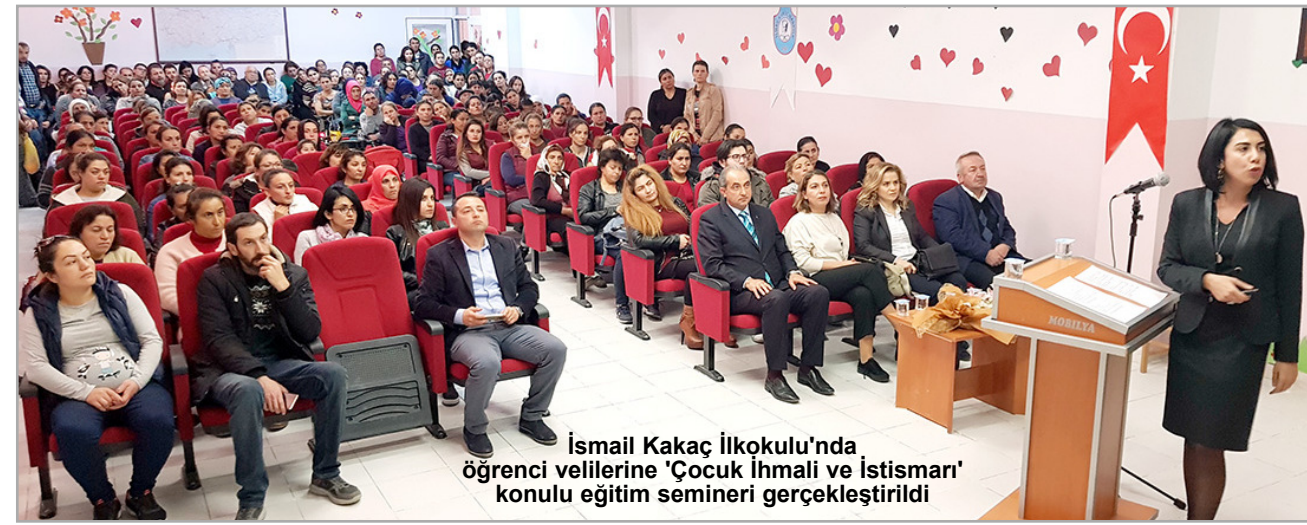
İsmail Kakaç İlkokulu'nda öğrenci velilerine 'Çocuk İhmali ve İstismarı' konulu eğitim semineri gerçekleştirildi